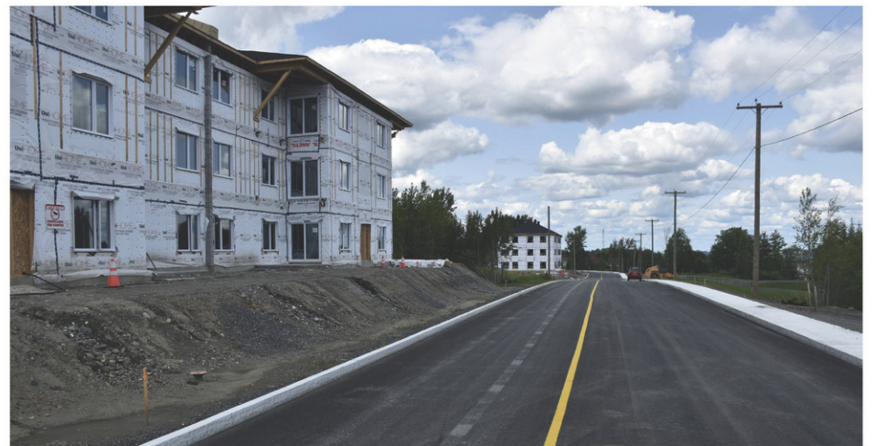
Le développement des Érables prend forme, à Coaticook, avec la construction de nouveaux immeubles.

L'agrandissement de l'école pourrait être une possibilité, reconnaît M me Munoz. Toutefois, le déménagement de certaines classes dans des locaux vacants de la communauté, comme cela s'est fait à Compton, semble plus envisageable.