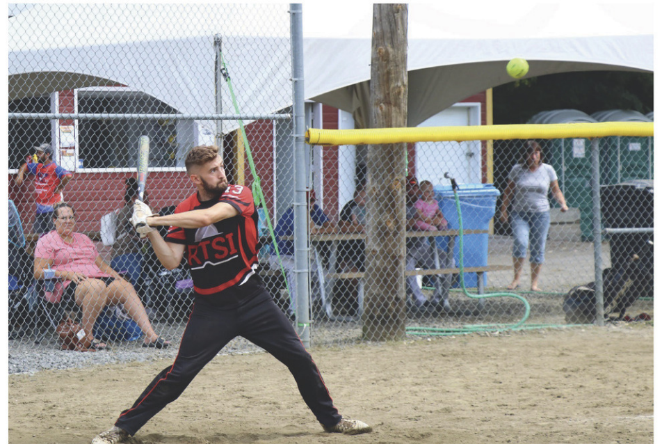
Le Défi Paul Boutin réunira plus d'une trentaine d'équipes à Coaticook, du 18 au 20 août.

Le Défi Paul Boutin aura également sa soirée