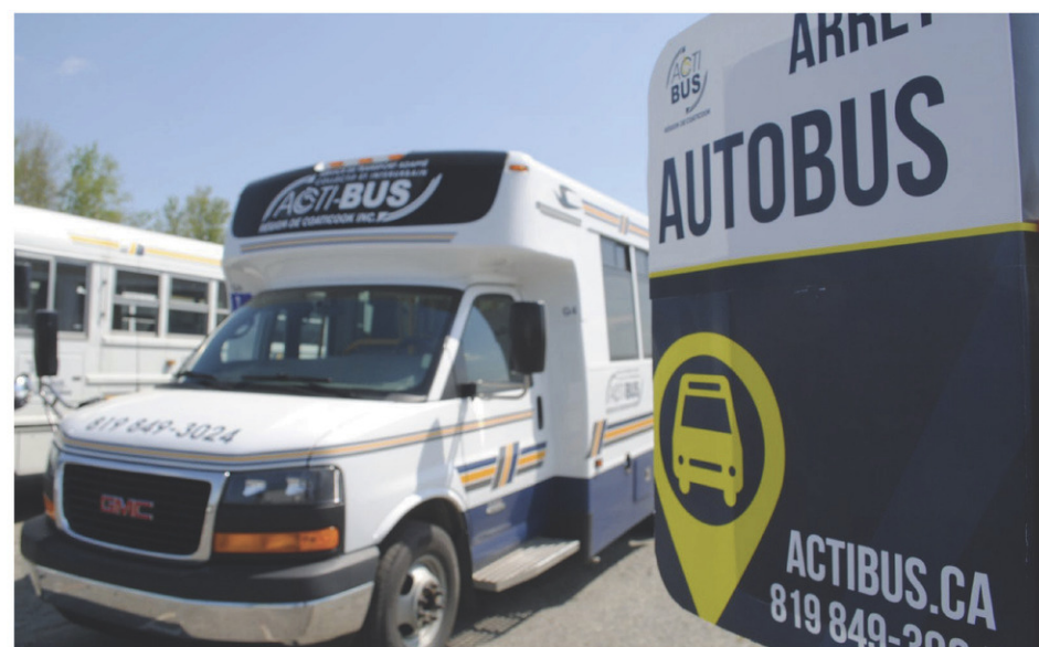
Les autobus d'Acti-Bus s'arrêteront dorénavant à Waterville dans le cadre de leur circuit interurbain.

Acti-Bus dévoilera également de nouveaux services au cours des prochaines semaines, souligne son représentant municipal.