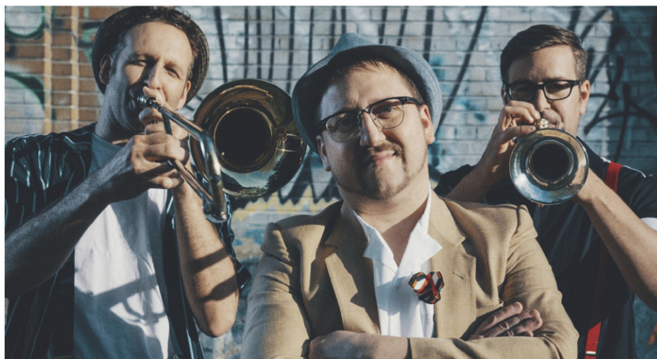
Le groupe Yelo Molo sera en spectacle dans le cadre de la Fête de la rentrée de la MRC de Coaticook, qui aura lieu le 16 septembre prochain, au parc Laurence.

Les activités seront gratuites lors de cette journée, à l'exception de l'offre gourmande des restaurants du coin et des « food trucks ». Notons que l'événement est une présentation de l'entreprise Cabico.