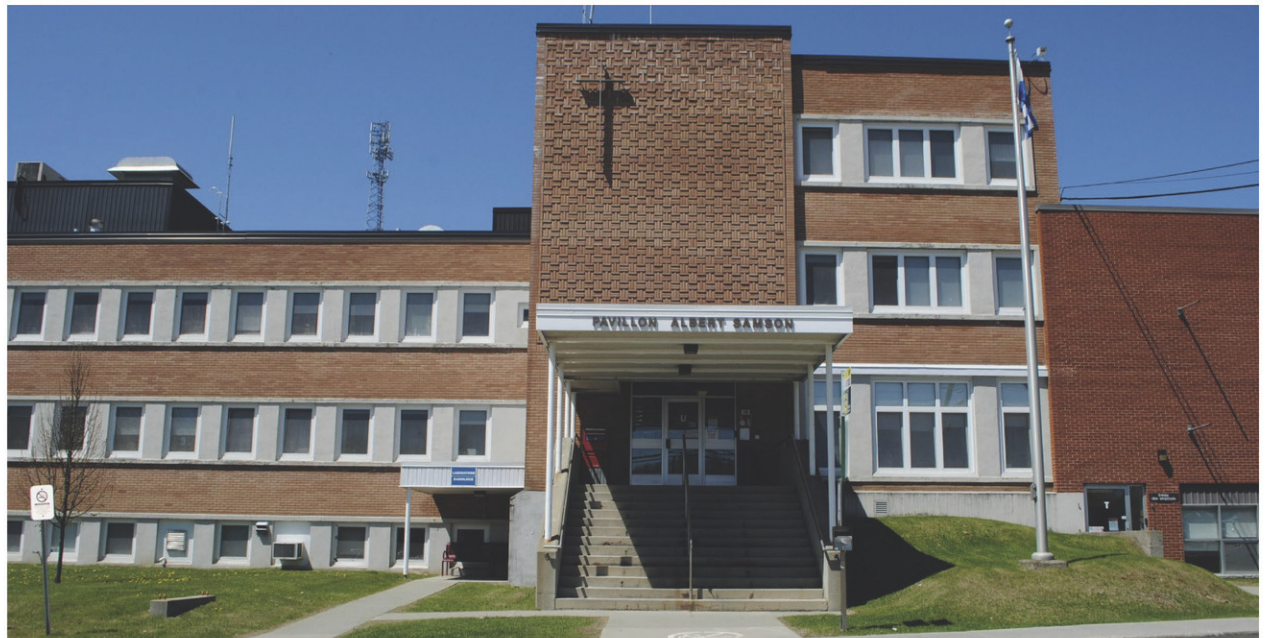
L'hôpital de Coaticook pourra compter sur un nouvel appareil de radiographie d'ici la fin du mois d'août.

Les transferts en ambulance vers ces lieux, en temps de découverte ambulancière sur le territoire de la MRC de