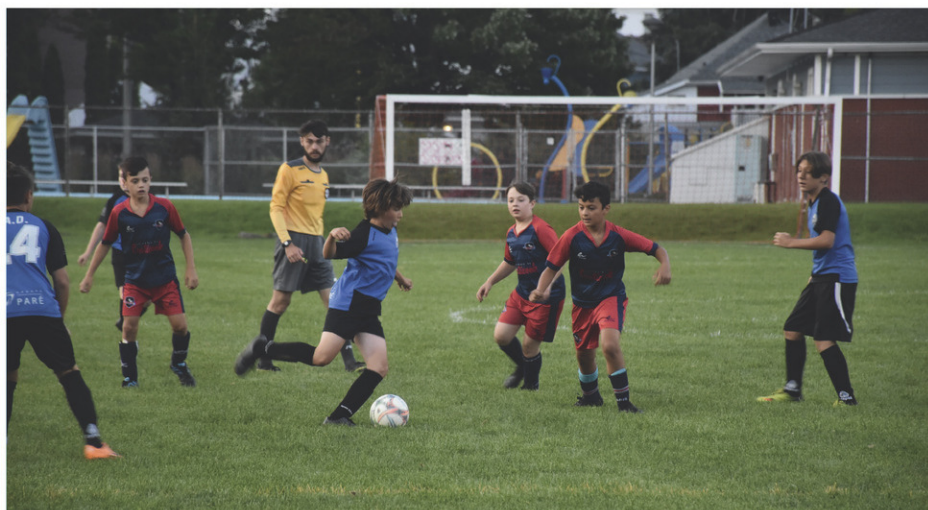
Au total, près d'une quarantaine de formations ont participé au Tournoi des frontières, lequel a eu lieu du 11 au 13 août dernier.

« Pour l'été qu'on a eu jusqu'à présent, on peut se compter chanceux parce que nous avons eu l'une des plus belles fins de semaine de la saison, rajoute-t-elle. Il y a eu seulement une heure de pluie. Dame nature a été de notre côté. »