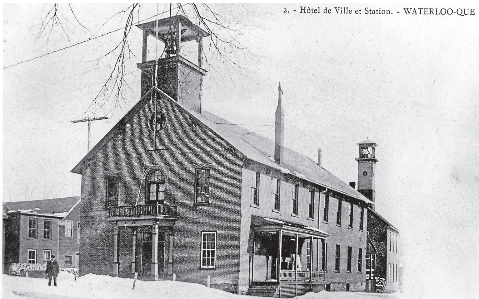
2. - Hôtel de Ville et Station. - WATERLOO-QUE