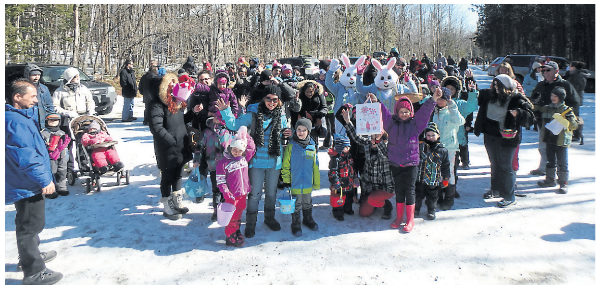
La Course aux œufs de Pâques est populaire à Shefford. Le nombre de participants ne cesse de prendre de l'ampleur au fil des ans.

Autre activité couronnée de succès: la mise sur pied d'un club de marche, ouvert à tous les groupes d'âge. À ses débuts en 2013, seule une poignée de marcheurs était de l'aventure. Ils sont aujourd'hui plus d'une soixantaine, affirme la