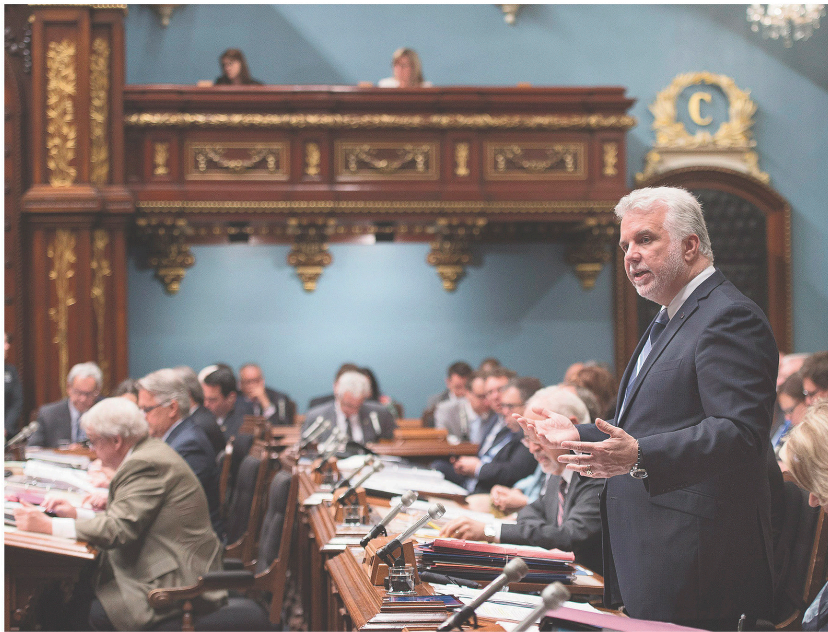
Le premier ministre Philippe Couillard a dû répondre aux questions de l'opposition après les nouvelles révélations de l'équipe d'enquête des quotidiens de Québecor sur ses liens avec Marc-Yvan Côté.