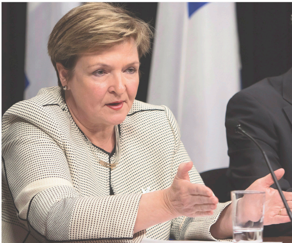
La vérificatrice générale du Québec, Guylaine Leclerc, confirme qu'il existe peu de recours pour les personnes dont les demandes sont refusées par l'AMF.

Au cours des quatre dernières années, moins de 10 % des demandes d'indemnisa-