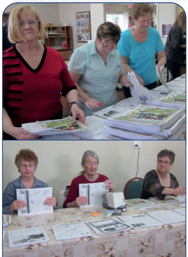
Les bénévoles du journal Le Vrai Citoyen

feuilles que l'on broche ensemble. C'est étourdissant de faire cela à cinq ou six personnes. Si les bénévoles étaient plus nombreux, cela prendrait moins de temps et supposerait moins de piétinement pour les mêmes personnes. D'autre part, c'est une agréable activité de famille, la famille du Vrai Citoyen , et vous recevez votre copie de journal gratuitement, ce qui n'est pas rien. Et puis, il y a des petites gratifications surprises occasionnellement.