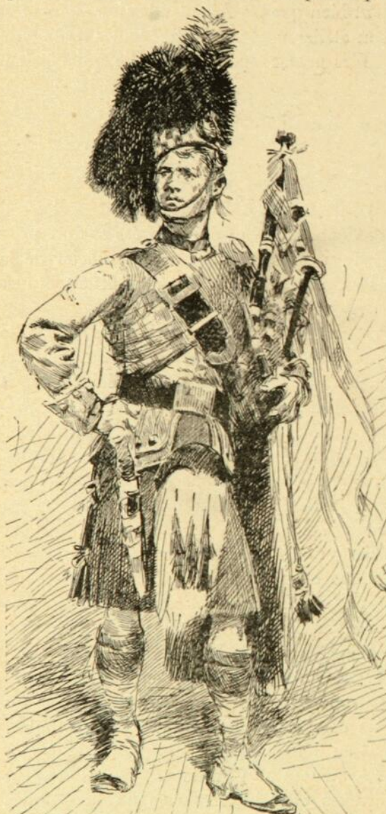
Piper d'un régiment écossais, par Detaille.

En novembre, le général Appert l'attache à sa personne en qualité de secrétaire, et Detaille prend part à la bataille du