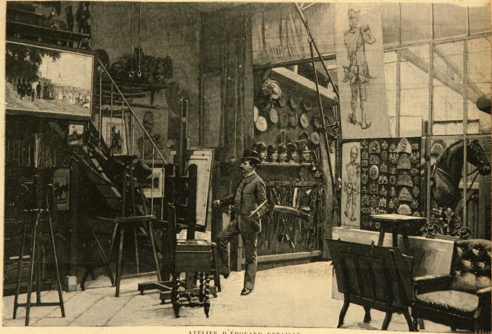
ATELIER D'ÉDOUARD DETAILLE