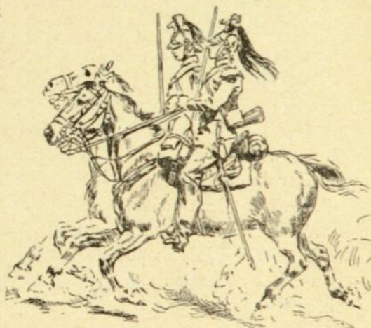
Dragons, par Detaille.