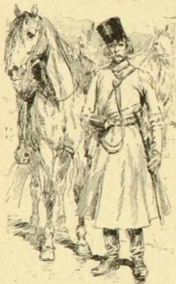
Cosaque, par Detaille.

tableau les Vainqueurs . Au Salon de 1872, il est invité par ordre à retirer son envoi, ce tableau, popularisé par la gravure, un des meilleurs du jeune maître, et que les Teutons ne digèrent pas encore! Ne l'avez-vous pas présente aux yeux, cette longue file de voitures allemandes, s'avancant lentement dans une route neigeuse, sous la conduite de soldats prussiens? D'affreux juifs à face sinistre, moitié receleurs, moitié croque-