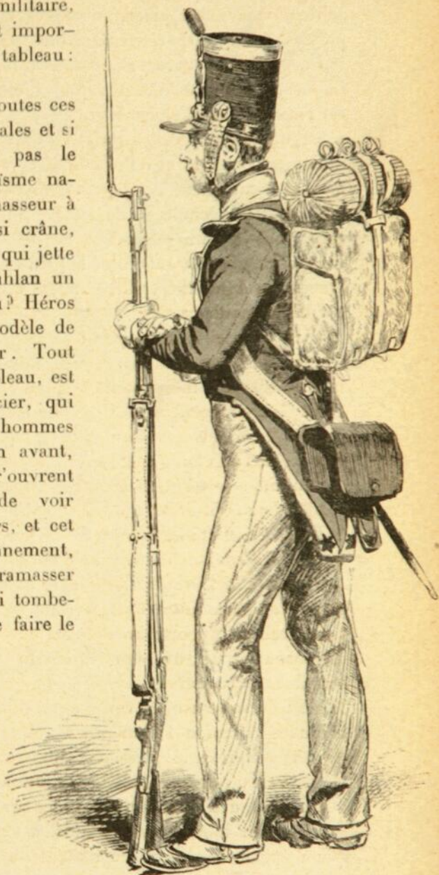
Infanterie française (1835) Par Edouard Detaille.

Au Salon de 1877, Detaille expose le Salut aux Blessés , qui faillit avoir le même sort que les Vainqueurs ; il fallut transformer les blessés allemands en blessés autrichiens, pour