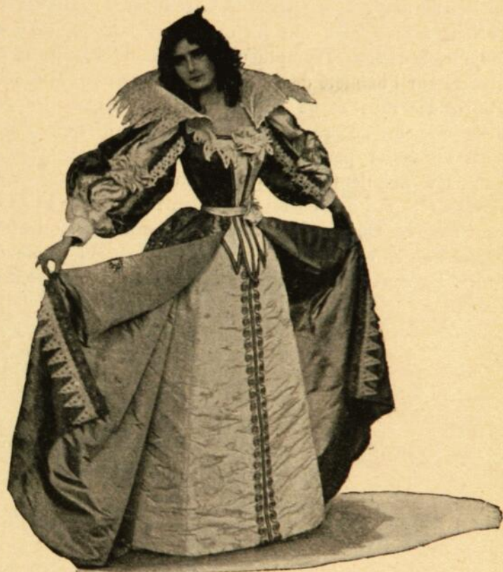
MADemoiselle CLÉO DE MÉRODE dans la Pavane,

Depuis un an, M lle de Mérode est l'héroïne de bien des incidents de coulisses dont la presse parisienne s'est fait l'écho. Lors du dernier passage à Paris du roi Léopold de Belgique, le souverain témoigna le désir d'assister à une