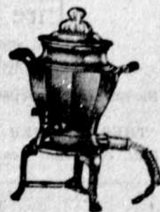
Accessoires et Appareils Electriques En Gros