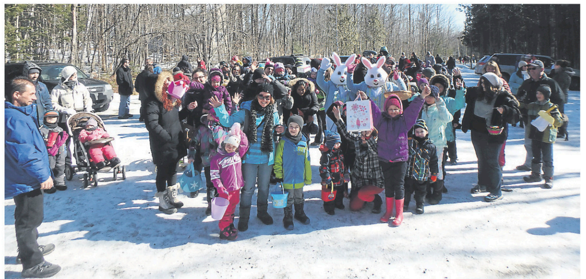
La Course aux œufs de Pâques est populaire à Shefford. Le nombre de participants ne cesse de prendre de l'ampleur au fil des ans.

Autre activité couronnée de succès: la mise sur pied d'un club de marche, ouvert à tous les groupes d'âge. À ses débuts en 2013, seule une poignée de marcheurs était de l'aventure. Ils sont aujourd'hui plus d'une soixantaine, affirme la