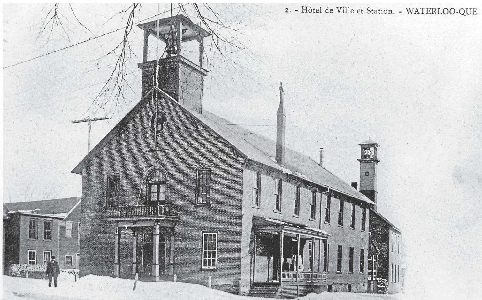
2. - Hôtel de Ville et Station. - WATERLOO-QUE

M. Pontbriand revient même sur quelques faits historiques peu connus du public, comme la présence d'une mine de cuivre près du chemin Frost. Après avoir été fermée durant quelques années, celle-ci a été remise en exploitation de 1950 à 1960. Quelques vestiges subsisteraient à cet endroit encore de nos jours.