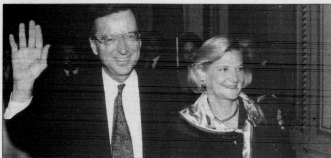
Robert Bourassa mettait fin à sa carrière politique en décembre 1993. On le voit ici avec son épouse, Andrée Simard, quittant l'enceinte de l'Assemblée nationale.

C'est sans doute pourquoi, tout au long de sa carrière, il a été vu comme un crypto-séparatiste par certains et comme un fédéraliste accommodant par