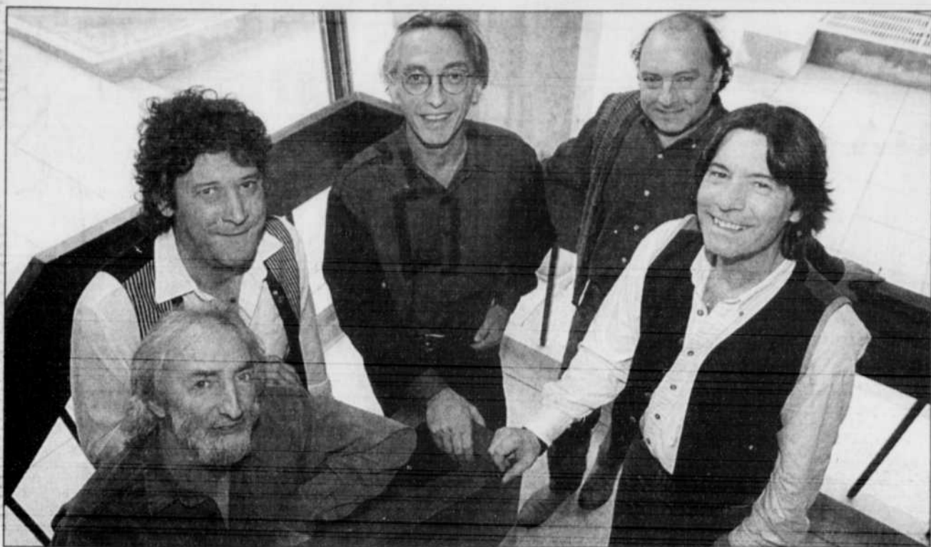
Les cinq musiciens d'Abbittibbi étaient de passage au Grand Théâtre de Québec, hier, pour lancer leur album Desjardins Abbittibbi Live .