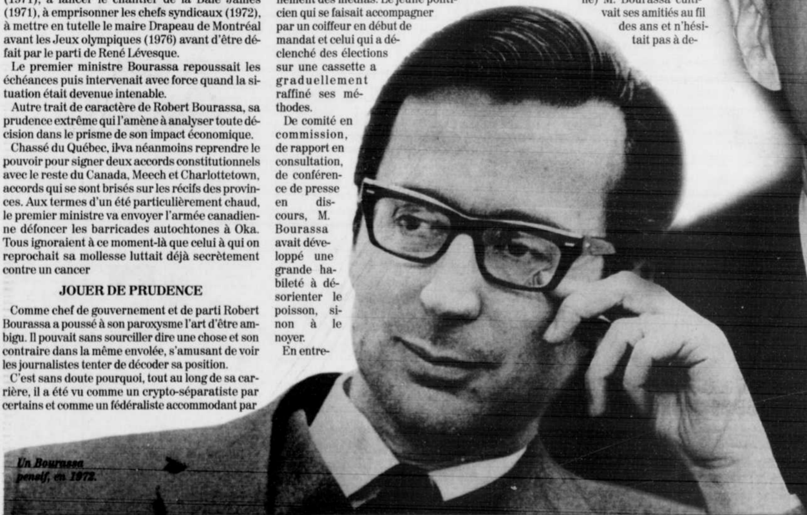
Un Bourassa pensif, en 1972.

Bourassa aura réussi à diriger la destinée des Québécois pendant près de 14 ans