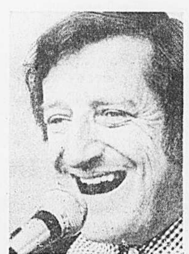
L'école Saint-François-Solano présente un spectacle de Jean Lapointe, mercredi, à 20h, à l'auditorium de l'école polyvalente Edouard-Montpetit, 6200, rue Pierre-de-Coubertin, afin de recueillir des fonds pour ses activités parascolaires.