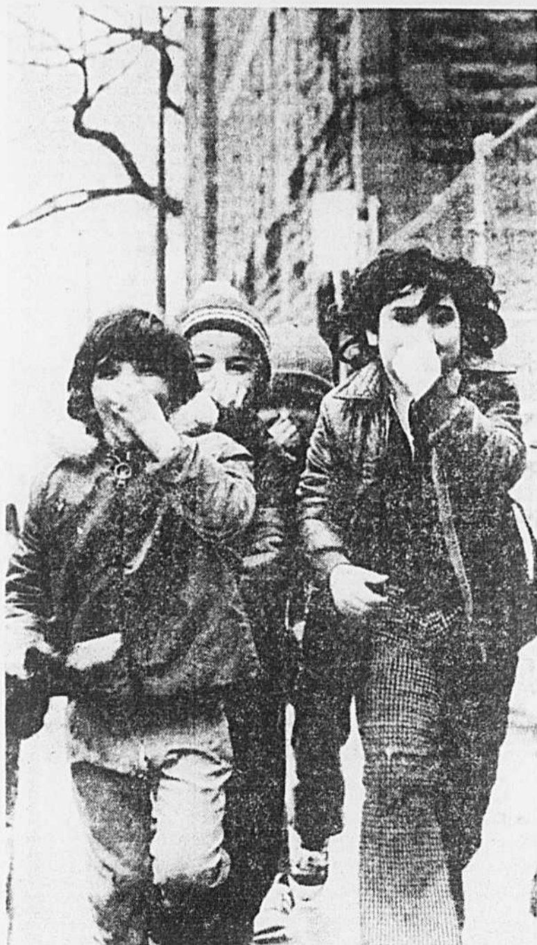
Genoux troués, frimousses espiègles, ils se moquent des effluents nauséabonds émanant des usines du voisinage. Pourtant, des rapports scientifiques de l'université McGill ont démontré que les enfants du secteur pétrochimique sont plus fréquemment atteints de maladies pulmonaires que les autres.