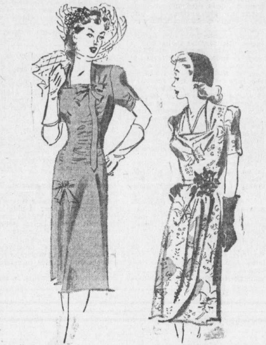
Décollés rectangulaires et manches courtes de fantaisie ou unies caractérisent les nouveaux modèles des petites robes légères.