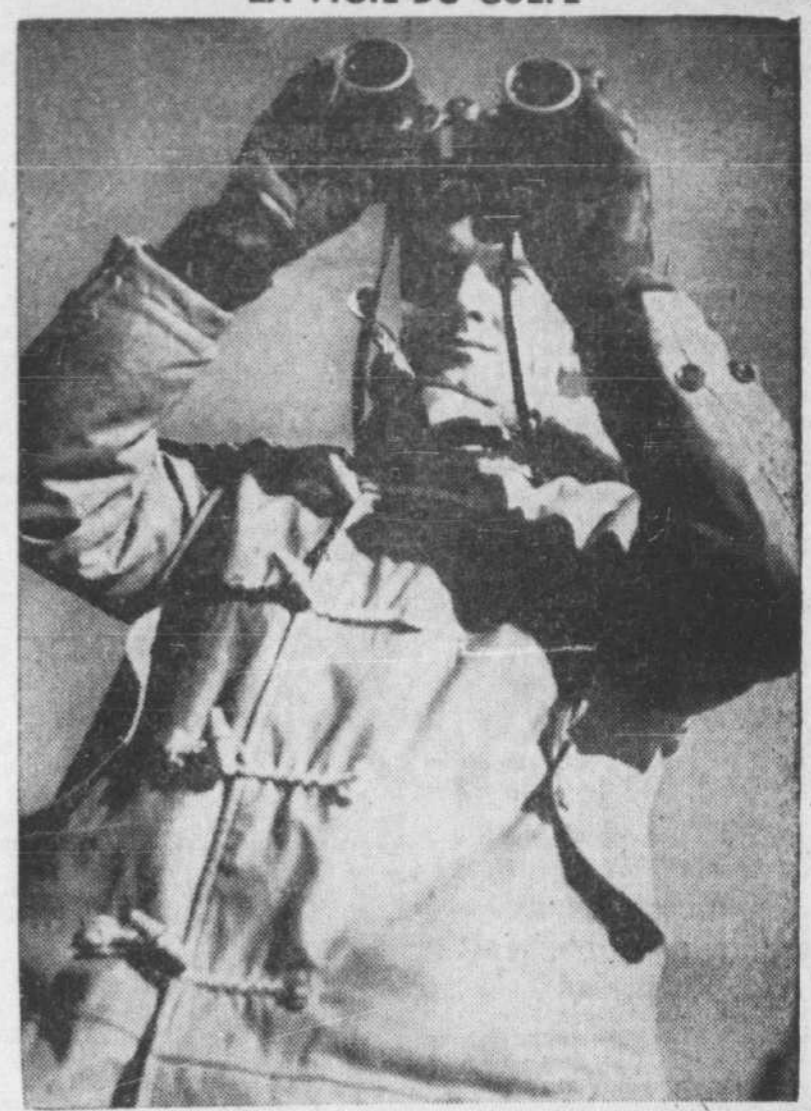
Toujours sur le qui-vive, les membres du Service de sauvetage hivernal du C.A.R.C. scrutent sans cesse les bancs de glace du golfe Saint-Laurent, en vue d'y découvrir des avions en détresse. La plupart de ces experts en matière de sauvetage viennent des provinces maritimes et comptent plusieurs années d'expérience dans l'agriculture, la pêche et la marine marchande. Ce sont de robustes Canadiens, qui ont passé la majeure partie de leur vie à lutter contre les éléments. Guidés et aidés par les avions, ils peuvent franchir un grand nombre de milles sur les glaces mouvantes ou les eaux du large pour porter secours aux aviateurs perdus dans le golfe.

Quoique les troupes étatsuniennes se servent de leurs propres munitions, l'Angleterre leur en a fourni, tel des bombes, des mines, des grenades, des réservoirs à essence et des pièces d'avions.