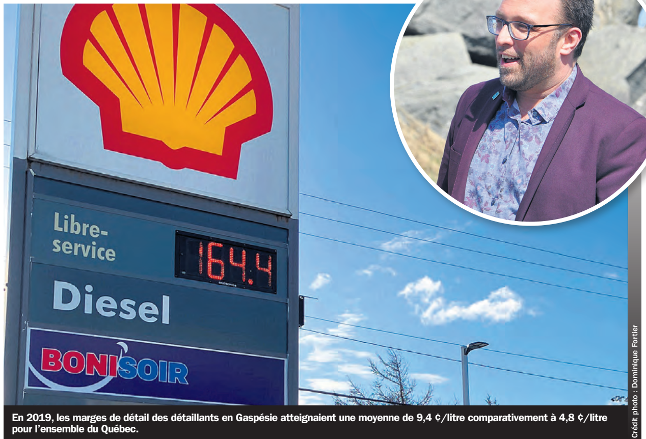
En 2019, les marges de détail des détaillants en Gaspésie atteignaient une moyenne de 9,4 ¢/litre comparativement à 4,8 ¢/litre pour l'ensemble du Québec.