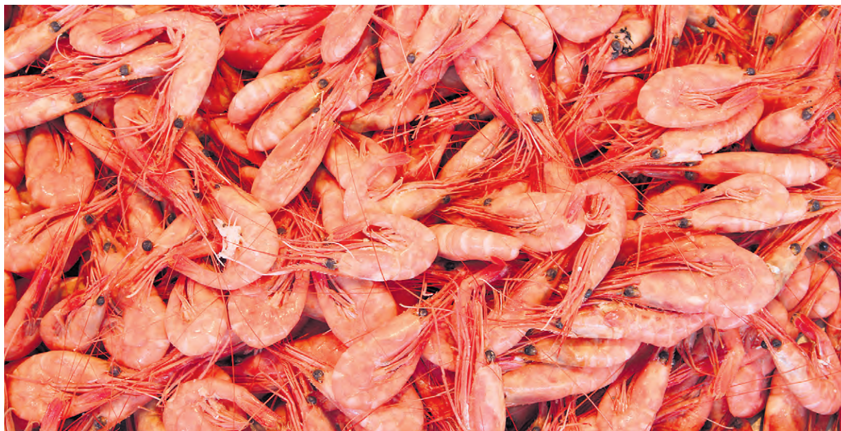
Cette année, seul 38% des 14 500 tonnes de crevettes nordiques autorisées ont été capturées.

Plusieurs crevettiers estiment qu'une pêche commerciale au sébaste – l'une des causes du déclin de la crevette – aurait dû être permise depuis un bon moment déjà. En mars, de