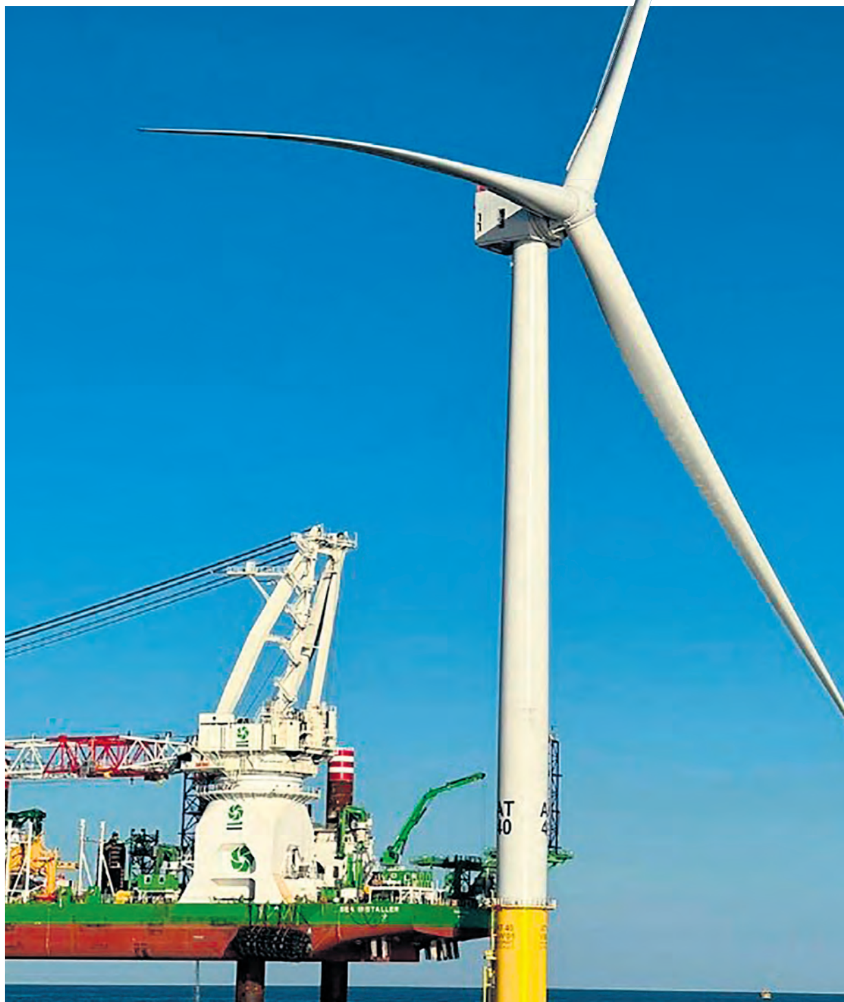
Les éoliennes font 260 mètres de haut. Une seule rotation complète des pales peut générer de l'électricité pour une maison moyenne pendant deux jours.

Commentez en ligne | www.gaspesienouvelles.com