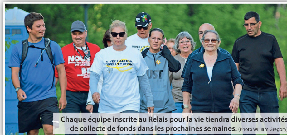
Chaque équipe inscrite au Relais pour la vie tiendra diverses activités de collecte de fonds dans les prochaines semaines.