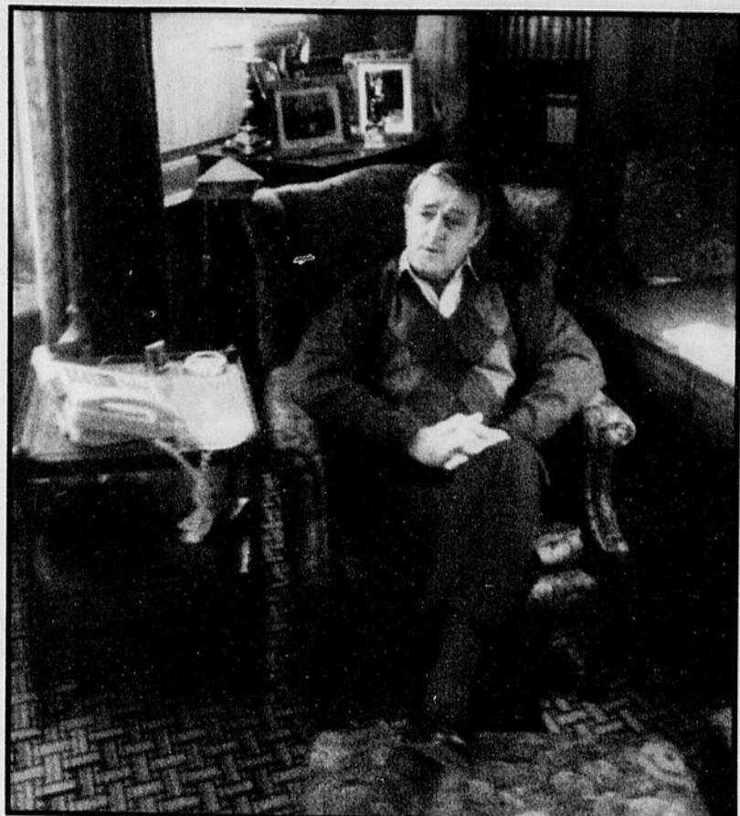
Le premier ministre Brian Mulroney, dans le cabinet de travail de sa maison officielle, à Ottawa, hier, a indiqué se sentir seul parfois, mais ne pas avoir l'intention de laisser tomber sa cause.

Aujourd'hui, le premier ministre n'exclut pas de réduire la taille de son conseil des ministres.