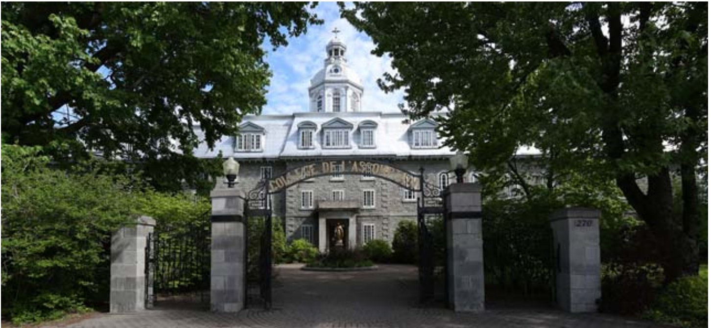
Le Collège de l'Assomption en 2016