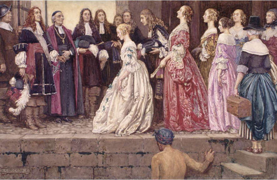
Arrival of the Filles du Roy in Québec in 1667. Picture d'Eleanor Fortescue-Brickdale.

military privileges “finally” bringing the wars of religion to an end. Later, under Louis XIV, there was a massive emigration of French Protestants in 1685 after their being denied both religious and civil liberties.