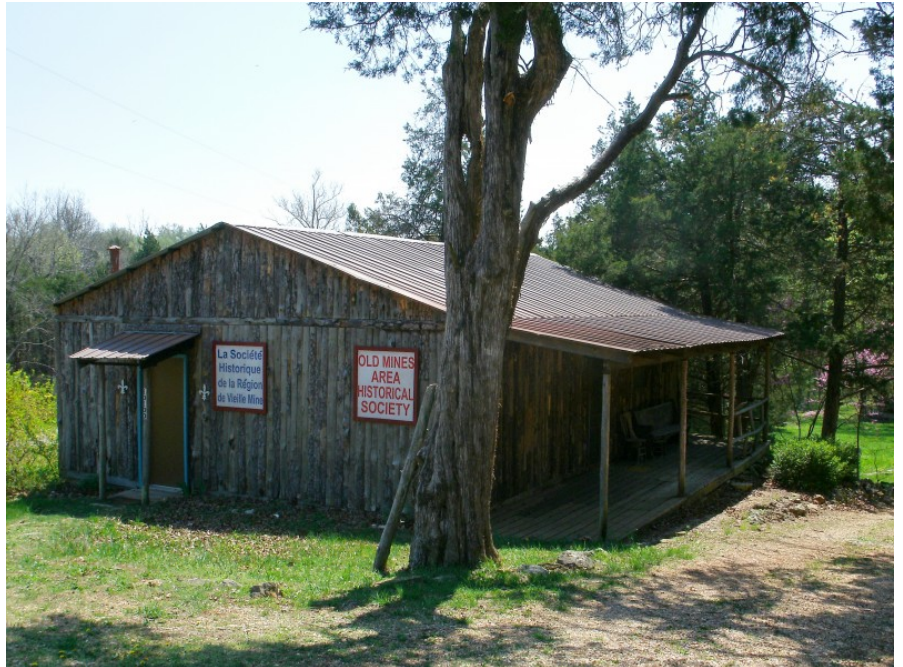
La vieille mine, Missouri.