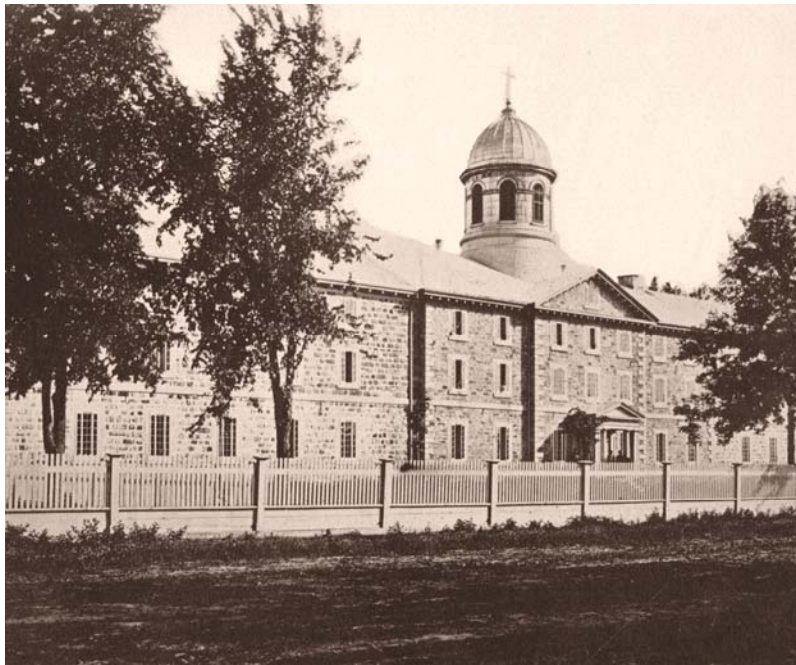
Collège de l'Assomption en 1869. Façade du boulevard de l'Assomption (reproduit avec l'autorisation du Collège)

prises, since many students came from New England states! It remains only to wish that another researcher will do the same work for Charron students.