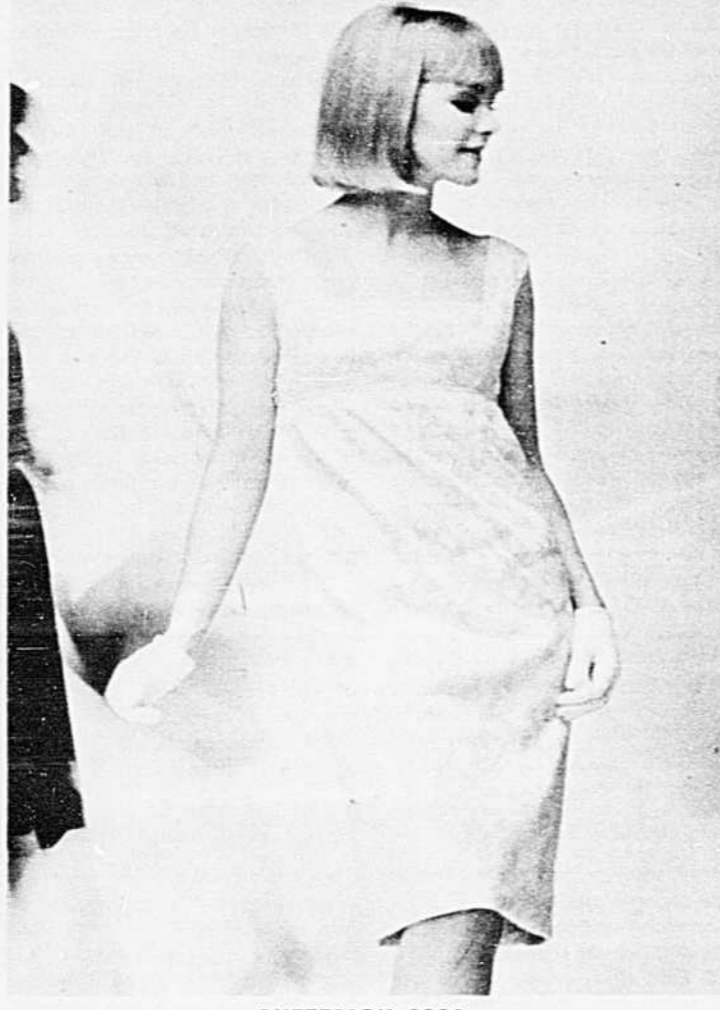
BUTTERICK 3339 Grandeurs 9-13 et 10-16

Avec l'automne s'annonce la liste très longue des soirées, bals, concerts, banquets, etc. Il faut donc songer à une toilette pratique, élégante et sobre. Butterick suggère cette robe courte "petit soir" à jupe droite plissée sur un corsage à taille Empire. L'encolure est carrée et la robe peut être portée avec ou sans manches. Pour varier cette toilette de base, vous pouvez porter tantôt un ceinturon de velours chiffon ou de poul-de-soie; tantôt un court boléro ou une veste de même tissu ou de velours... laissez aller votre imagination et le tour est joué. Ce patron peut même être allongé pour en faire une toilette longue pour le bal. Ce patron est en vente à la Lingerie Poirier et au Magasin Gosselin de St-Jérôme.