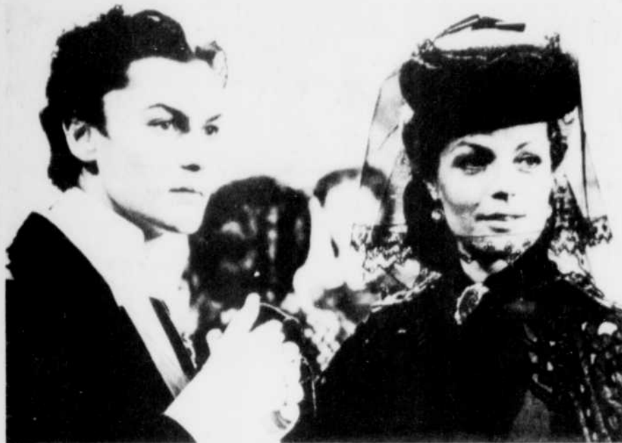
Helmut Berger et Romy Schneider dans "Le Crépuscule des Dieux" de Luchino Visconti.

(AFP) - Absent des écrans depuis mars 1977 - date de sa tentative de suicide - l'acteur autrichien Helmut Berger, 37 ans, fera sa réapparition devant le public en juin prochain, avec la sortie du premier volet de "Victoria" (Victoria). Cette ambitieuse trilogie cinématographique espagnole, est actuellement tournée par Antoni Ribas à Barcelone.