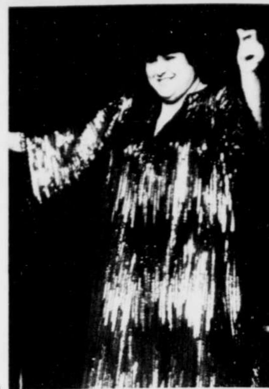
Née dans un milieu pauvre, Ginette Reno a su tracer sa voie... avec sa voix.