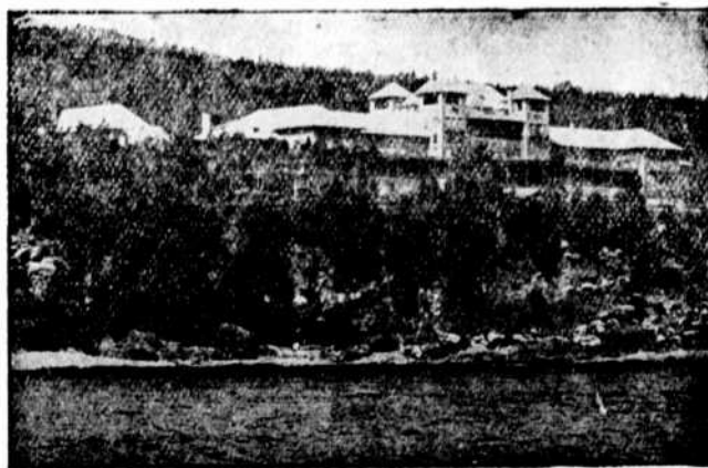
MANOIR RICHELIEU, MALBAIE