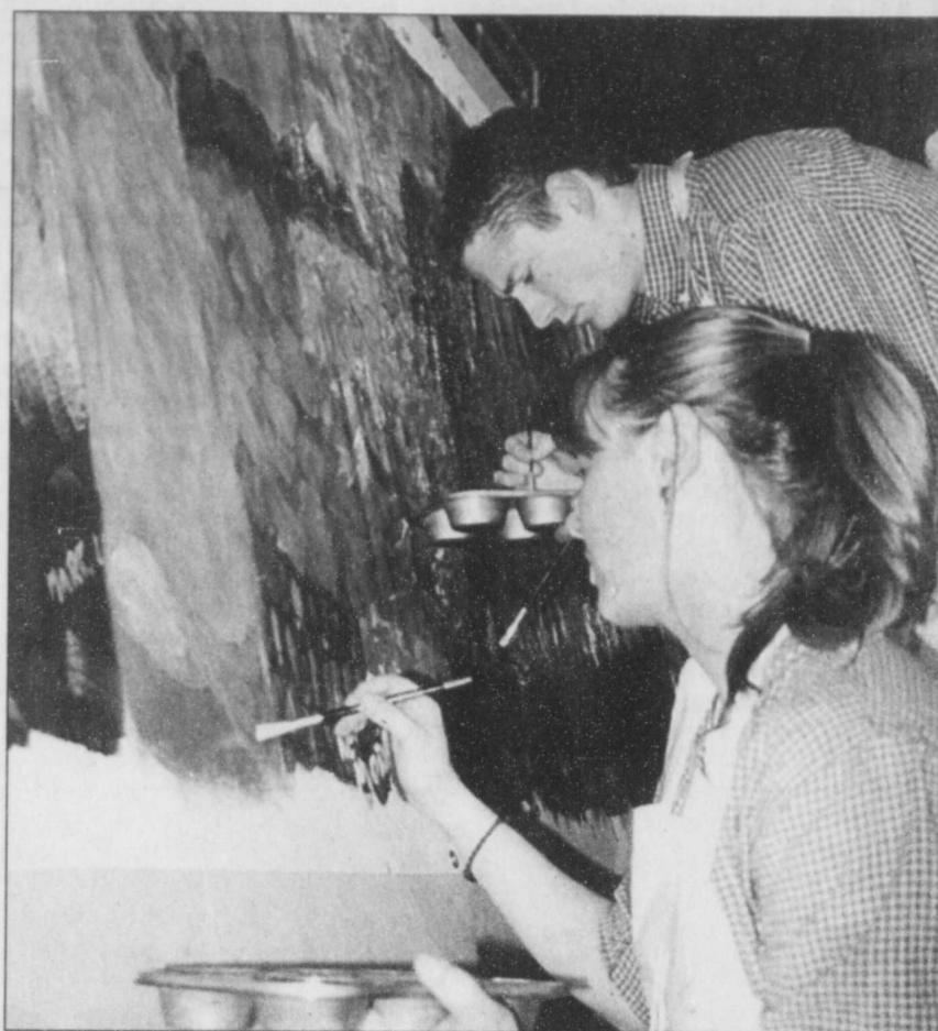
En mai, il y aura « Quatre arpents de fleuve à repeindre ».

Le musée donne aussi dans le théâtre, les conférences et activités sociales. Le directeur général se garde bien d'avoir transformé l'institution muséale en salle paroissiale. « La mission des musées est de faire de l'animation et de