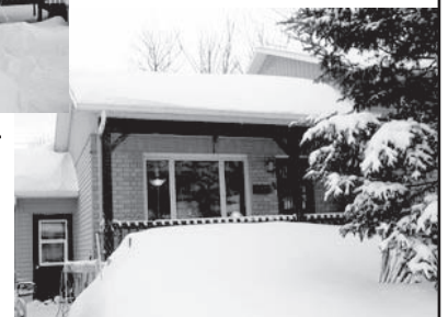
711, du Marais