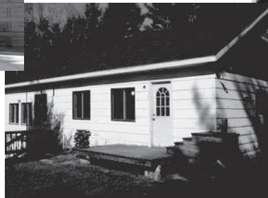
1150, Chemin des Pins