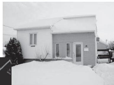
18, du Maire-Lesieur