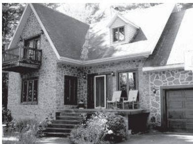
331, Louis-de France