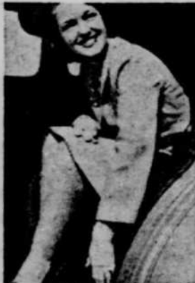
4 Essayez la Banquette Arrière—elle est haute comme un fauteuil... confortable.