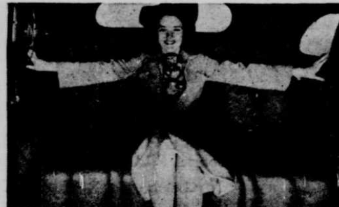
5 Etendez les Bras! Vous jouirez de l'espace pour les jambes, les bras, et au-dessus de la tête. L'auto "flotte" sur des ressorts en acier Amola. Le montage de la carrosserie sur caoutchouc supprime la vibration.