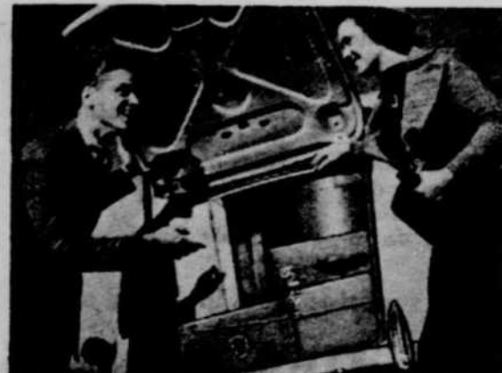
7 Dis-Donc—Ces Ingénieurs ont Pensé à Tout! En plus d'avoir 22% plus d'espace, ce compartiment est garni avec de l'étoffe pour protéger vos bagages. C'est une GROSSE malle.