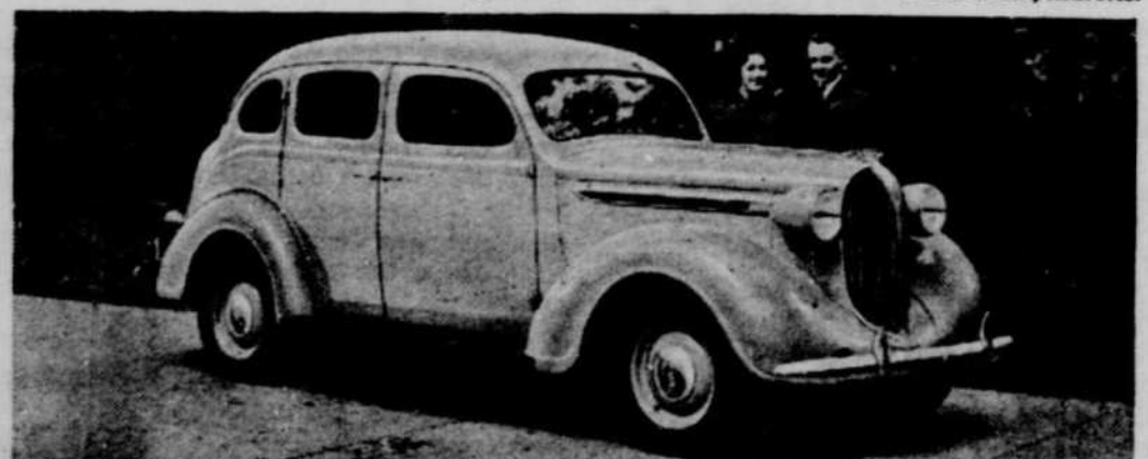
8 Célébrant le Dixième Anniversaire! Regardez ce splendide nouveau Plymouth. Montez et conduisez-le. Constatez son roulement. Véritablement ce qu'il vous offre. Aujourd'hui, des milliers d'usagers expriment leurs sentiments en disant: "Plymouth est fait pour durer et coûte moins cher pour l'opération." Son prix est parmi les plus bas!