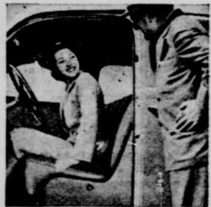
2 Et Maintenant Montez et Voyez comment le siège avant peut être aisément réglé. Il est plus haut lorsqu'il est tiré à l'avant.