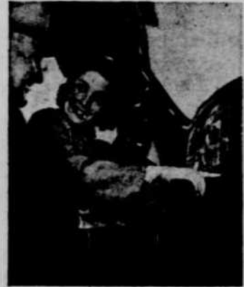
3 Voici une Première! Les tableaux de bord sont plus faciles à lire. Le frein à main est en dessous du tableau.