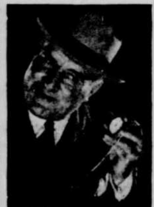
6 Ecoutez Votre Montre—Plymouth est isolé quant aux bruits à cinq endroits.