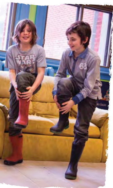
ATELIER BOUGE EN MUSIQUE

L'initiation au conte musical permet aux enfants de développer leur créativité en inventant un conte qu'ils mettent ensuite en musique. Par des activités d'écoute, ils apprennent à identifier les émotions transmises par la musique.