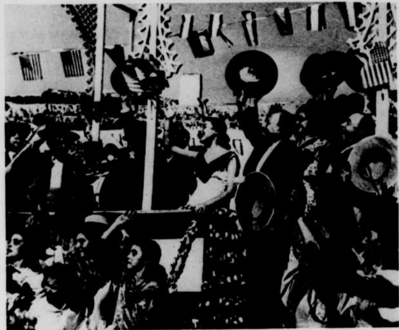
Une scène du film Bienvenue Mr Marshall! , une production espagnole à l'affiche de CBFT, dimanche le 6 juin, de 9 h. à 10 h. 30 du soir.