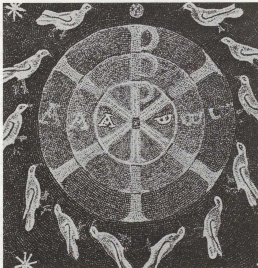
Illustration: Mosaïque du baptistère de la cathédrale d'Albenga (Italie). Les trois cercles représentent la triple immersion faite au nom du Père, du Fils et du Saint-Esprit; les colombes symbolisent les apôtres.

* Une première série de 13 émissions du 2 janvier au 27 mars sera suivie de 13 émissions consacrées à Pierre Teilhard de Chardin, après quoi nous reviendrons à l'oecuménisme durant 26 semaines.