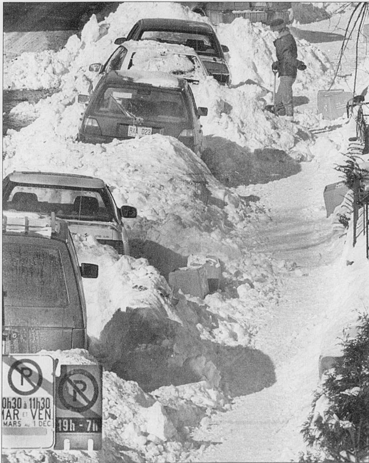
RUE DE LORIMIER, hier après-midi, cette pancarte qui annonce le déneigement pour la nuit suivante était installée là... depuis 36 heures. Les lenteurs et cafouillages de l'opération déneigement sont actuellement le sujet de conversation n° 1 des Montréalais. Lire notre reportage en page A 3.