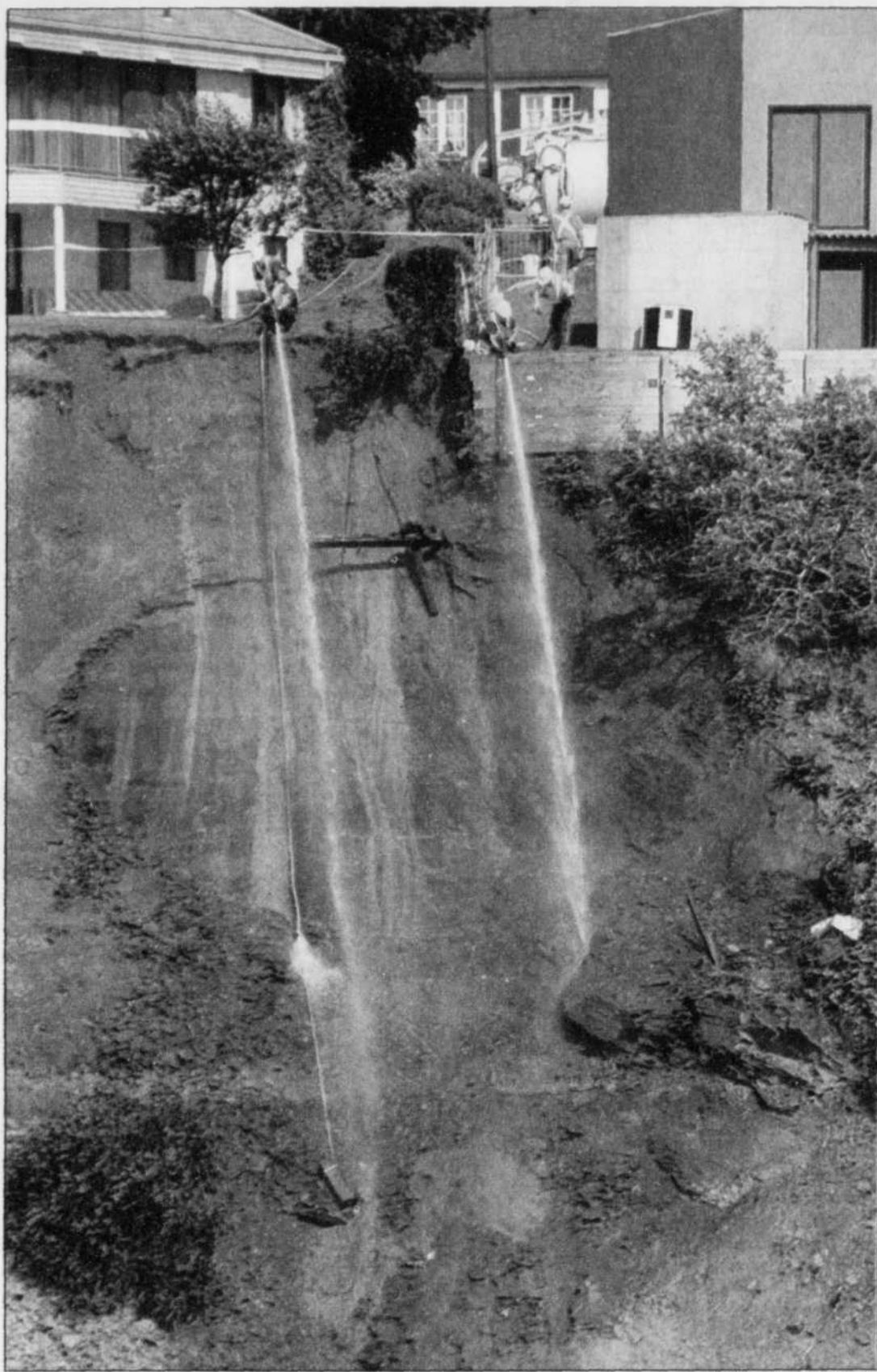
En dépit des jets qui crachent 3500 litres d'eau à l'heure chacun, à peine 200 mètres cubes de terre et de roches ont dévalé la pente menant à la Plage Jacques-Cartier, hier. Cela signifie qu'il reste encore en suspension 1000 mètres cubes, soit la moitié de la masse instable révélée par la faille qui a fait son apparition dans la cour des maisons surplombant la plage. À lire en page A2