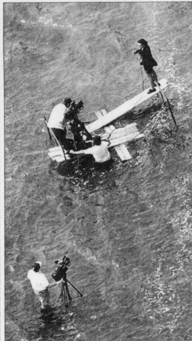
Une équipe de la télé avait dressé son attirail dans la seule zone accessible en bas de la falaise, laissée à la merci des caprices du fleuve...

■ QUÉBEC — La falaise résiste. En dépit de la présence de trois jets qui crachent 5500 litres d'eau à l'heure chacun, à peine 200 mètres cubes de terre et de roches ont dévalé la pente menant à la Plage Jacques-Cartier, hier. Cela signifie qu'il reste encore en suspension 1000 mètres cubes, soit la moitié de la masse instable révélée par la faille qui a fait son apparition dans la cour des maisons surplombant la plage.