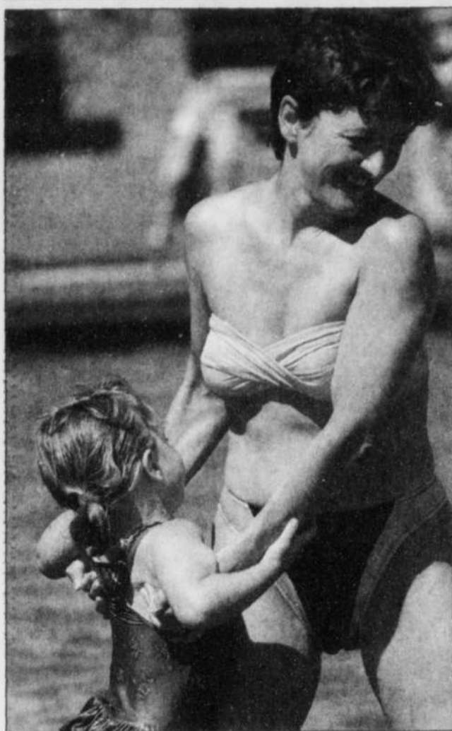
Les mélanomes frappent chez des gens de plus en plus jeunes, certains ayant à peine 30 ans.

Québec, le médecin chercheur croit que le Fichier « échappe » 52,8% des nouveaux dossiers pour les mélanomes. Il sous-estimerait de 85% l'apparition d'épithéliomas.