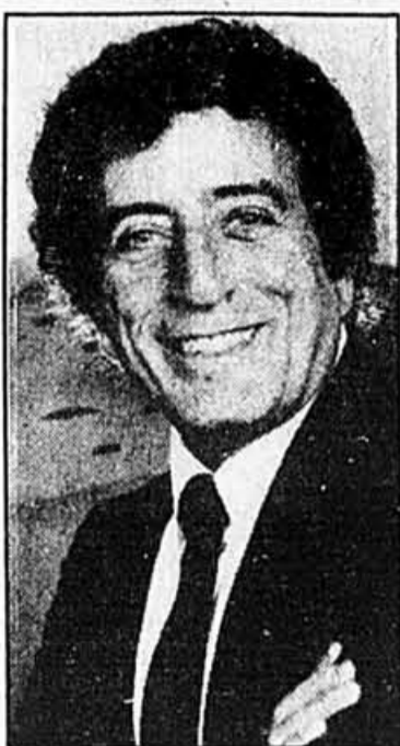
Avec Tony Bennett, un retour à la belle époque du jazz d'avant le rock.

Parmi les autres voix qui se feront entendre dans le cadre de ce festival axé sur le jazz chanté, on retrouvera : Jon Hendricks (auteur de Birdland ), le quatuor a cappella The Persuasions et les chanteuses Sheila Jordan et Flora Purim.