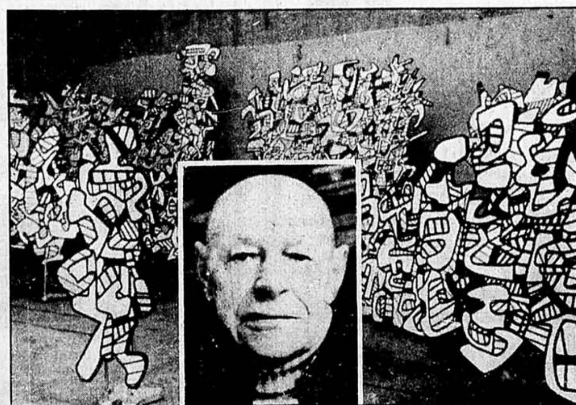
Jean Dubuffet et quelques-unes de ses oeuvres caractéristiques de sa production.

En 1962, commence le cycle de l'hourloupe, caractérisé par des petits personnages grossièrement tracés, des êtres primitifs