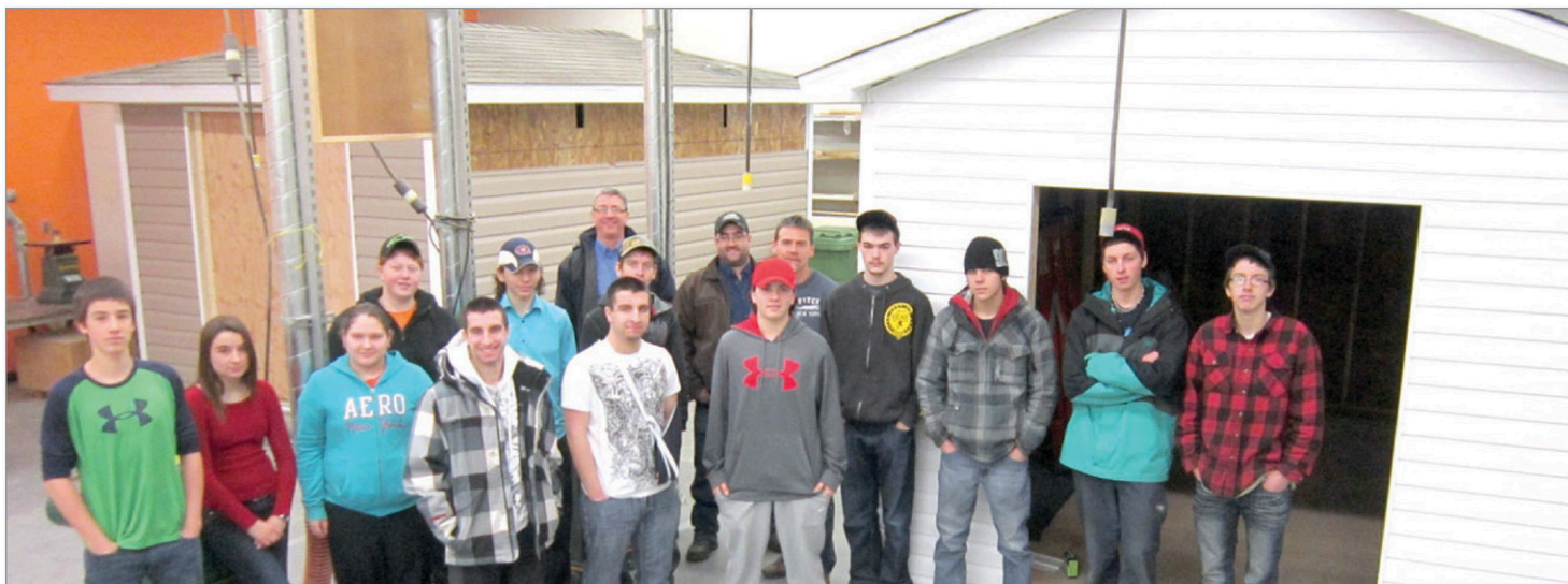
La construction de cabanons n'a plus de secrets pour les élèves du cours de charpenterie de l'école communautaire Aux Quatre Vents de Dalhousie.

Plans et matériaux ont été fournis par les deux partenaires afin d'effectuer le montage des deux cabanons. De plus, afin de mieux répondre aux besoins en