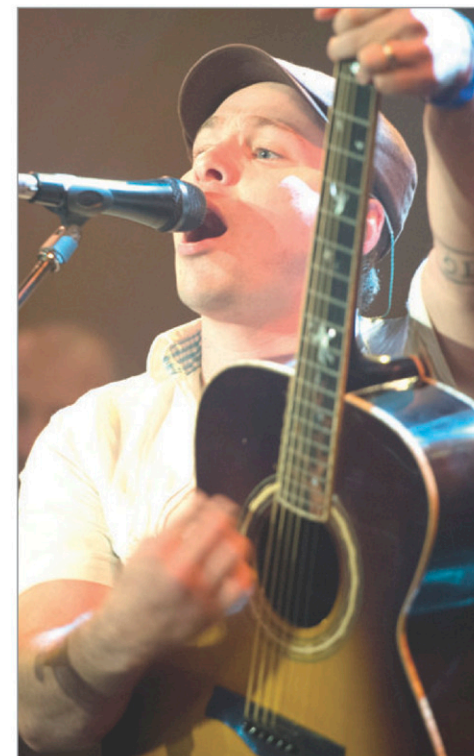
David Jalbert sera dans la région le 7 février à l'occasion de la Grande fête de la motoneige.

De ce 3e opus, un nouveau simple, la pièce titre «Y'a pas de bon silence» vient tout juste d'être mis en ondes. Inspiré du décès prématuré d'un jeune homme de Port Cartier, l'auteur-compositeur-interprète rapporte, de façon poignante, le fruit d'une discussion avec une proche de la victime. L'album qui s'est déjà écoulé à plus de 15 000 exemplaires depuis sa sortie à l'automne 2012 était en nomination au dernier gala de l'ADISQ dans la catégorie « Album folk de l'année ». (Source : Jupiter Spectacles)