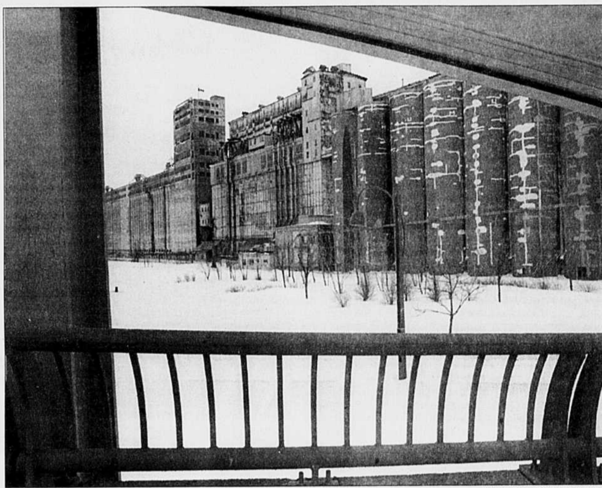
Le silo numéro 5 était vu ce week-end comme le futur campus international d'avant-garde de l'Amérique.