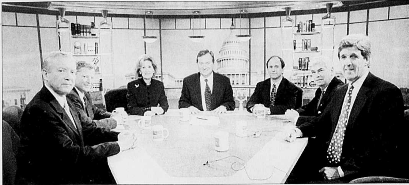
De gauche à droite, les sénateurs républicains Orrin Hatch (Utah), James Inhofe (Oklahoma) et Kay Bailey Hutchison (Texas), l'animateur Tim Russert, de l'émission Meet the Press (NBC), et les sénateurs démocrates Paul Wellstone (Minnesota) Christopher Dodd (Connecticut) et John Kerry (Massachusetts)