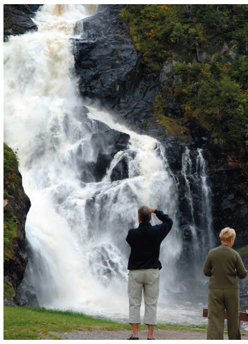
TOURISME SAGUENAY-LAC-SAINT-JEAN La chute Ouiatchouan

Québec ne voit donc aucune menace pour la « valeur » du village historique de Val-Jalbert, la rivière Ouiatchouan et la chute du même nom, un site protégé depuis 1996 en vertu de la Loi sur le patrimoine culturel. « Les