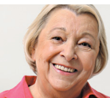
Notre chroniqueuse Lise Payette fait relâche cette semaine.

« Au pouvoir depuis tellement d'années, marqués par des luttes constitutionnelles trop souvent menées sur le terrain de leurs adversaires, plusieurs libéraux du Québec en sont venus à oublier qui ils sont. Leurs options politiques ont trop souvent été défendues dans les termes d'une mitigation des idées des autres. Le recueil de principes publié par Claude Ryan en 2002 est un élément de réponse, mais le retour aux sources doit puiser plus profondément dans notre histoire, aux racines mêmes d'un mouvement d'idées séculaire, dont la noblesse et la profondeur sont susceptibles de rallier une majorité de Québécois. Car telle l'une de ces fameuses cordes sensibles des Québécois dont parlait Jacques Bouchard, le penchant pour les idées libérales n'est ni un défaut de nationalisme, ni une carence de social-démocratie. C'est quelque chose en soi, qui a son âme et ses valeurs propres, à la recherche constante des points d'équilibre entre les extrêmes. Et c'est en s'appuyant sur son histoire, sur ce versant de l'âme québécoise, que le Parti libéral du Québec sera à nouveau capable de proposer un avenir meilleur et de rassembler tous ceux et celles qui voudront s'y retrouver. »