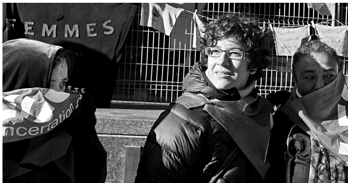
Un rassemblement pour la Journée nationale de commémoration et d'action contre la violence faite aux femmes a été tenu jeudi devant le Palais de justice de Montréal.