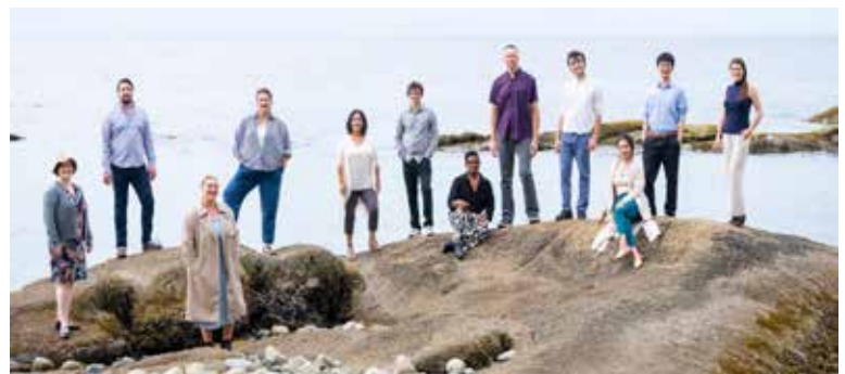
L'Ensemble vocal musica intima

« Je souhaite que les collaborations qui seront établies par ce concert puissent continuer dans le temps, fleurir et mener vers d'autres projets. Avec ce concert, je voulais montrer à PODIUM 2024, à des cheffes et chefs de chœur, à des compositeurs et compositrices et autres professionnels du milieu que la musique et les langues autochtones ont leur place dans la musique chorale qui a longtemps été exclusive et que la musique est une façon d'apprendre à se connaître et de faire des ponts entre les cultures. Les artistes autochtones peuvent et doivent être mis de l'avant aux côtés de chœurs et d'artistes exceptionnels », conclut-elle pleine de conviction.