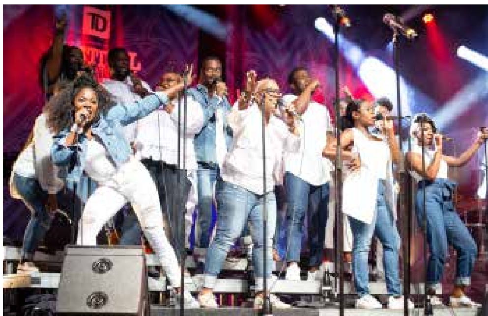
Jireh Gospel Choir au Festival international de Jazz de Montréal en 2019

« Le gospel porte un message d'espoir, tellement important depuis la pandémie. Je constate que les gens y sont très sensibles, qu'ils soient croyants ou non. C'est la raison d'être du gospel et c'est ce que nous transmettons durant nos concerts. Les personnes noires qui sont venues de force en Amérique ont amené cette musique et ont survécu en partie parce qu'ils chantaient, parce qu'ils chantaient ensemble, c'est dire toute la force de la musique et de ce qu'elle représente. En venant à un concert de gospel, on n'a pas besoin d'être noir ou croyant, on n'y assiste pas pour observer, on y va pour participer. On vit tous des choses difficiles et on peut vivre la connexion avec cette musique. La musique gospel ne nie pas les difficultés ou le malheur, mais elle est tournée vers l'espoir d'un temps meilleur », conclut la cheffe de chœur en soulignant à quel point notre monde a besoin d'espoir ces jours-ci.