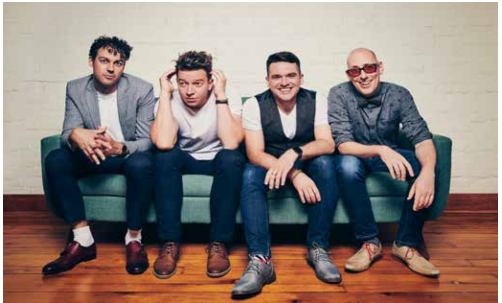
Le quatuor vocal QW4RTZ

PODIUM Jeunesse : Tous en chœur avec QW4RTZ, présenté à la Salle Pierre-Mercure le 20 mai 2024 à 16 h, sera le fruit de répétitions et d'ateliers auxquels sont conviés les jeunes choristes. Profitant d'un lundi férié, le comité de PODIUM 2024 a eu l'idée d'élargir l'offre du congrès et festival en s'adressant aux enfants et en créant pour eux un événement de découverte du chant choral avec le quatuor vocal QW4RTZ.