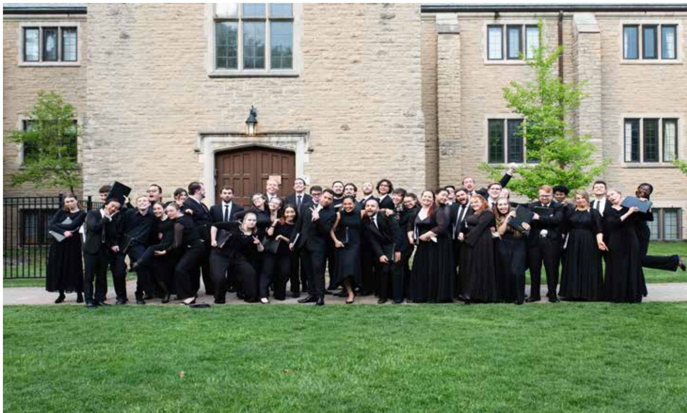
La dernière édition du Choeur national des jeunes du Canada a eu lieu en 2022