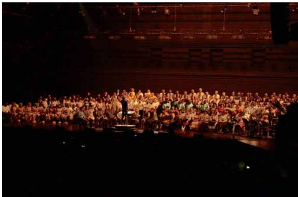
Le concert Souffles proposait des improvisations contrôlées, semblables à celles que l'on pourra entendre le 19 mai.

« Il s'agit d'une grande aventure musicale, chorale et humaine », résume-t-il, simplement.