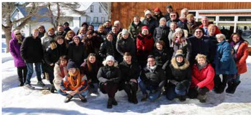
Photo de groupe à CAMMAC - 2024

La prochaine (et 34 e !) revue musicale Broadway du Lyric Theatre Singers sera présentée du 13 au 15 juin prochain. Mais c'est les 23-24-25 février dernier que 42 chanteurs passionnés se sont rassemblés pour une fin de semaine de répétition intensive mémorable à CAMMAC. Le groupe dévoué s'est donné pour mission d'offrir un spectacle inoubliable, alimenté par leur amour commun de la musique de Broadway et du chant choral.