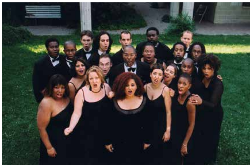
Nathaniel Dett Chorale