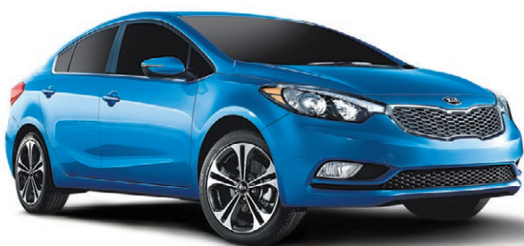
Modèle SX BA illustré* ROUTE (BA) : 6,1 L/100 KM VILLE (BA) : 8,8 L/100 KM*