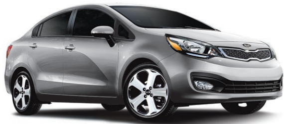
Modèle SX avec Navigateur illustré* ROUTE (BA) : 6,3 L/100 KM VILLE (BM) : 8,8 L/100 KM*