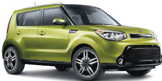
Modèle SX Luxe illustré* ROUTE (BM) : 7,8 L/100 KM VILLE (BM) : 9,9 L/100 KM*