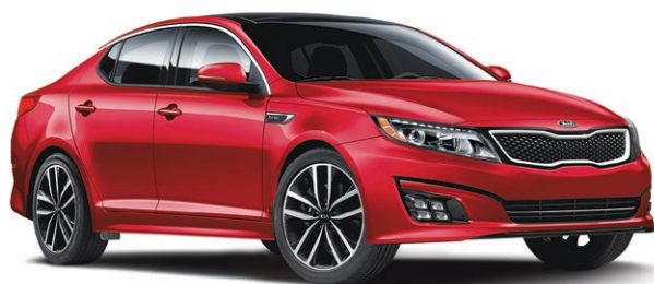
Modèle SX Turbo illustré* ROUTE (BM) : 5,7 L/100 KM VILLE (BM) : 8,9 L/100 KM*