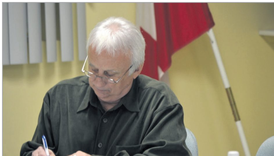
Le maire de Saint-Léonard, Carmel St-Amand.

Le conseil a aussi souligné le manque de respect de certains citoyens envers les arrêtés municipaux qui gâche ainsi la qualité de vie d'une partie de la population. Par exemple, les bruits excessifs provenant de systèmes de son, véhicules à moteur, feux d'artifice ou toute autre source après 23 h sont à l'encontre de l'arrêté 114-0-2003 « Interdiction des bruits ». Dans l'arrêté 40 « Service d'Incendie », les feux à ciel ouvert sont interdits ainsi que les feux où l'on brûle pratiquement n'importe quoi produisant des odeurs et de la fumée nauséabonde dans le voisinage. Dans l'arrêté 26-2013-E « Contrôle des animaux », il est interdit de laisser son animal déféquer