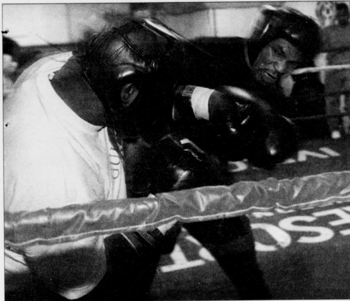
Les partenaires d'entraînement de Mike Tyson n'ont pas eu la vie facile, hier, alors que ce dernier les a malmenés à quelques reprises. Tyson affrontera Buster Mathis le 16 décembre.