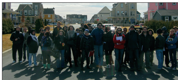
Les étudiants de l'atelier APA2300 lors d'une visite de site à l'hiver 2010