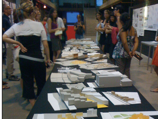
Atelier d'été à Barcelone

Cette année encore, plusieurs de nos étudiants ont complété la 3 e année de leur baccalauréat à l'étranger et l'École a accueilli 21 étudiants de France, de Belgique, de Suisse, d'Espagne, d'Italie, du Mexique et du Brésil. 17 étudiants ont participé à un atelier d'été à Barcelone.