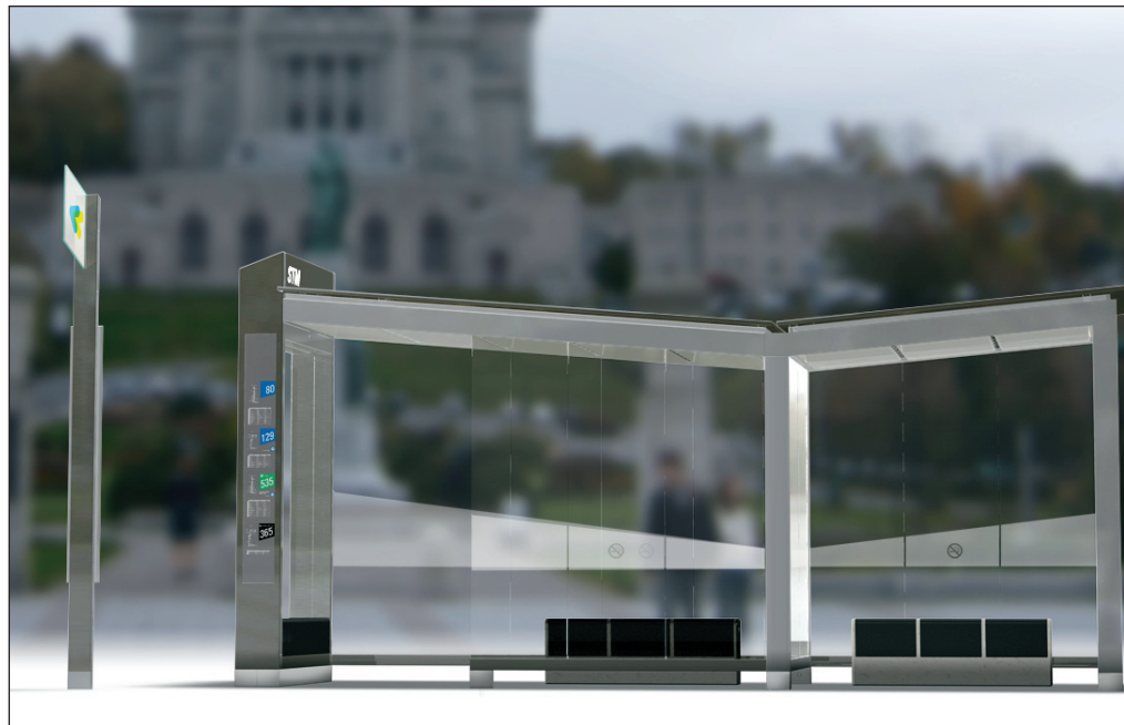
Concept proposé par LEBLANC + TURCOTTE + SPOONER dans le concours de design d'abribus

Les multiples activités de recherche théoriques et pratique des professeurs ainsi que les activités de rayonnement qui en ont résulté ont permis à l'École d'assurer sa position non seulement comme lieu de formation professionnelle par excellence, mais aussi comme une institution qui enrichit continuellement ses enseignements des résultats d'une réflexion approfondie sur les grands enjeux de notre discipline. Cette position de chef de file a déjà été confirmée par la décision du Design