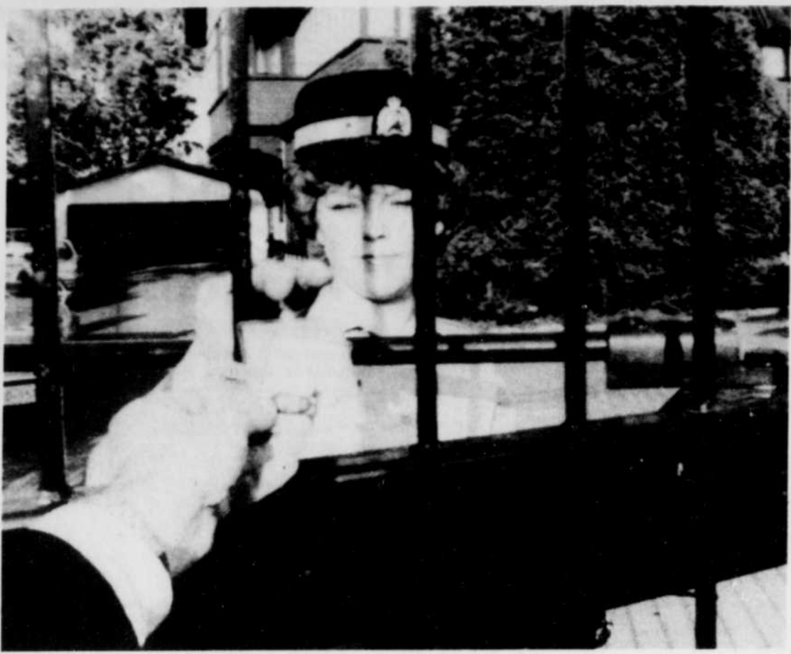
La sécurité a été renforcée autour de l'ambassade de Turquie à Ottawa, après le récent attentat dont a été victime un