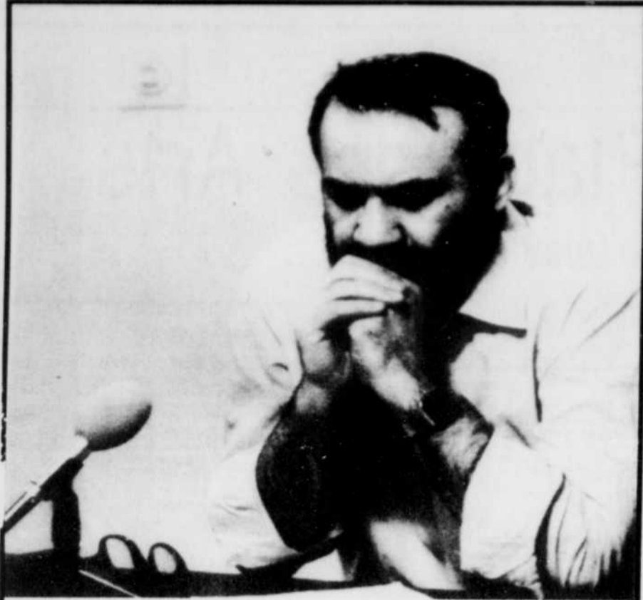
L'ex-ministre iranien des Affaires étrangères, Sadegh Ghotbzadeh, est en attente de sa sentence, alors que les juges sont entrés en délibération dimanche.