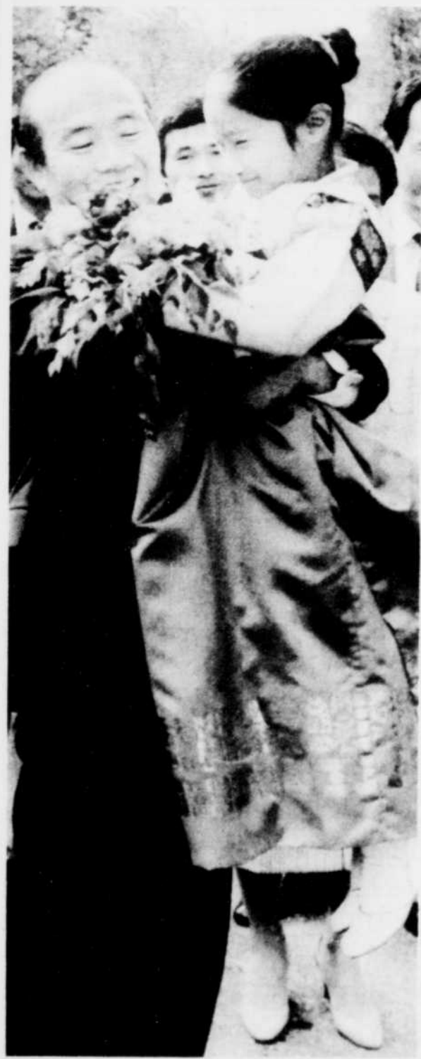
Hommage aux Canadiens

Heures d'ouverture: du lundi au vendredi: de 8h.00 a.m. à 5h.30 p.m.; Samedi de 8h.00 a.m. à midi