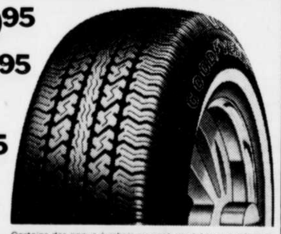
Certains des pneus à rabais ne sont pas tel que représenté

Les pneus offerts à rabais s'adaptent à la plupart des voitures. Pose comprise. Offres en vigueur jusqu'au 4 septembre 1982.