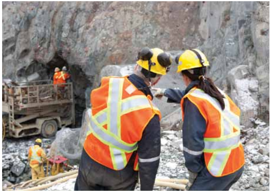
Des travailleurs effectuent de la consolidation de terrain au portail d'une rampe souterraine.

À ses yeux, il faut faire participer les travailleurs pour avoir de bonnes idées. La mine Lac Herbin possède un système d'opportunités d'amélioration : quand les travailleurs repèrent des situations à risque, ils informent leur superviseur du problème et proposent une solution. « Dernièrement, notre réparateur de foreuses à béquille, qu'on appelle "Docteur machine", a réaménagé son atelier lui-même, raconte M. Bélanger.