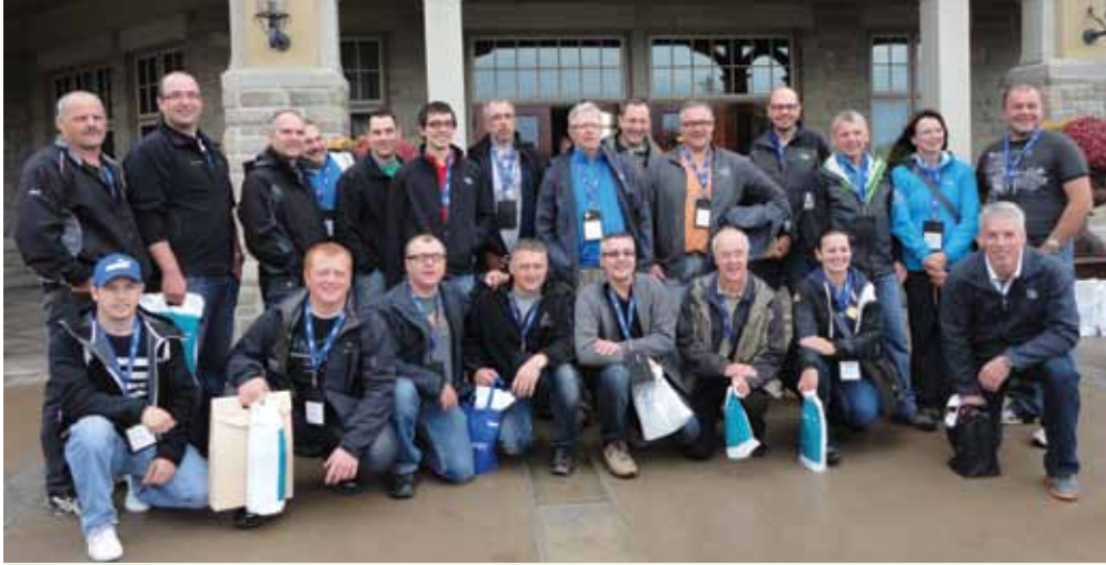
La délégation du Québec, composée de représentants de la CSST, de l'Association minière du Québec ainsi que des sites miniers Raglan, Matagami, Westwood, La Ronde et Lapa