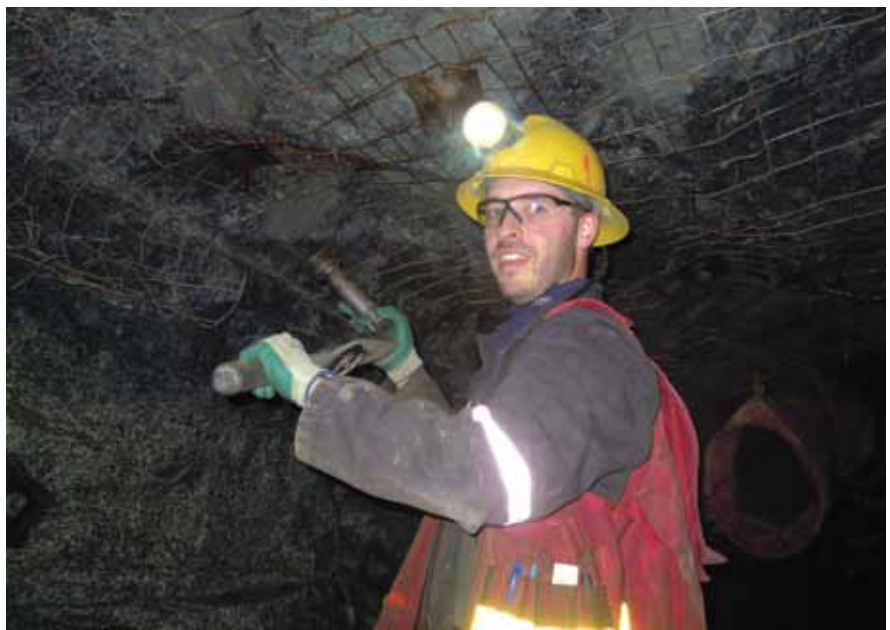
Un technicien minier de la mine Lac Herbin vérifie le torque des boulons.