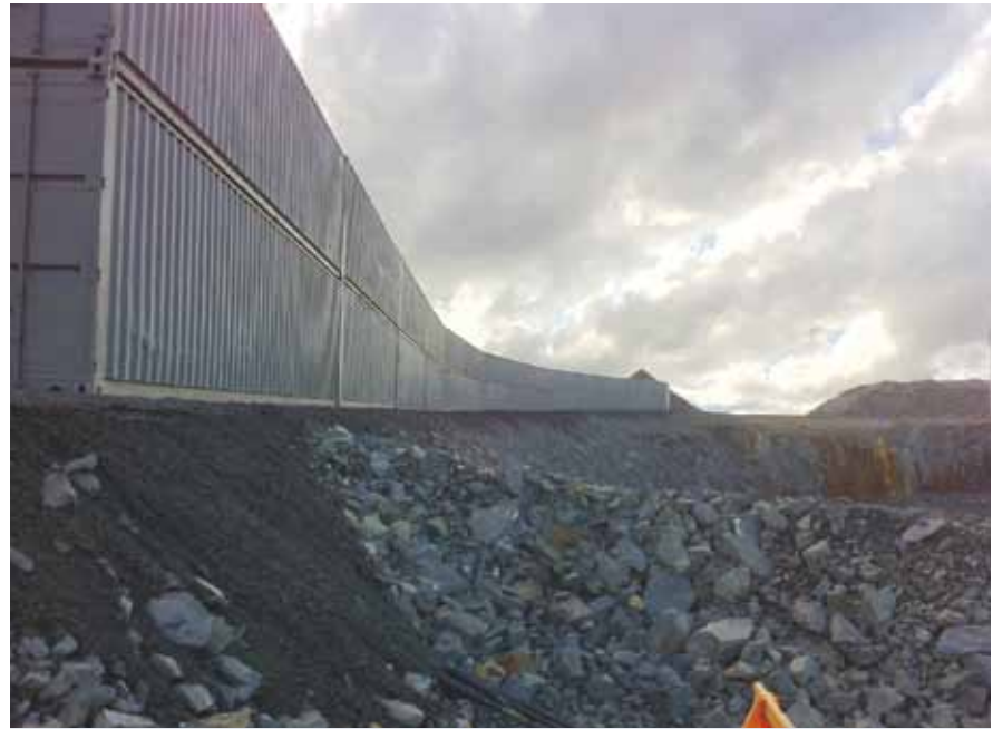
Une vue du mur acoustique fait de conteneurs de la rampe principale

Le déplacement des sons se trouve favorisé par deux facteurs principaux : la météo et la position de la machinerie. En effet, en présence de conditions météorologiques propices à la propagation sonore, majoritairement dans le cas où les vents proviennent du sud, les activités de la mine sont entendues de l'autre côté du mur vert, rappelant ainsi aux Malarticois qu'ils se trouvent