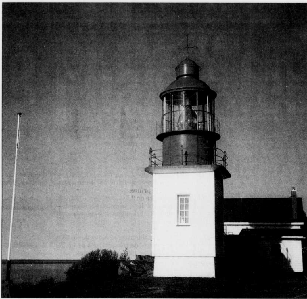
Le phare de Cap-Chat (ci-dessus) fait partie des trois qui seraient contaminés par mercure.

Les trois phares sont tous situés dans la MRC Denis-Riverin, sur la rive nord de la péninsule gaspésienne. Ouverts au public, ils sont fréquentés par plusieurs milliers de personnes, chaque année. Il semble toutefois que certains individus soient plus sensibles à la contamination par le mercure, d'où la décision prise par le fédéral.