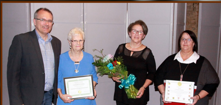
PAGE 3 Le Partage St-Eusèbe souligne ses 30 ans