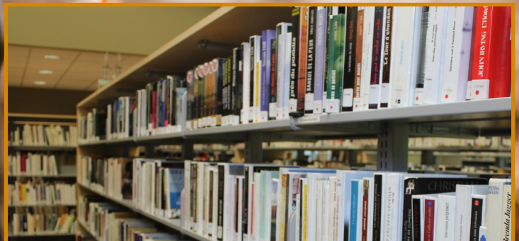
PAGE 5 BiblioQUALITÉ : Note parfaite pour Princeville!