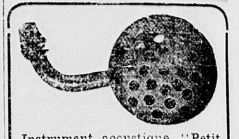
Instrument acoustique "Petit Géant"

Le Président était resté auprès d'elle aussi longtemps que le lui permettaient ses occupations. La malade le demandait toutes les fois qu'elle avait un moment de