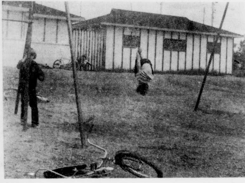
Mais non, mais non! je vous assure que je ne tomberai pas... l'histoire n'en dit pas plus long...