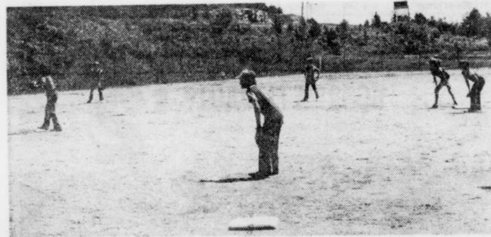
Les jeunes joueurs de baseball peuvent pratiquer leur sport préféré au parc Gouin. Chaque matin, et ce jusqu'au 31 août, les moniteurs de l'OTJ les recevront pour leur enseigner la science de frapper des circuits.