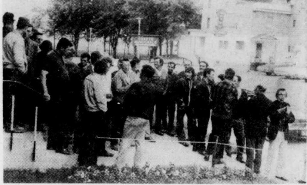
Une cinquantaine de cultivateurs s'apprentent à entrer au CMC de Lac-Mégantic.