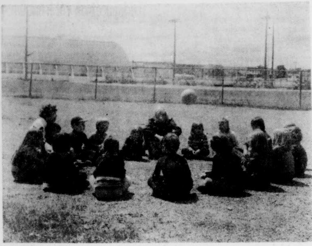
Drôle de façon de se lancer la balle: assis!