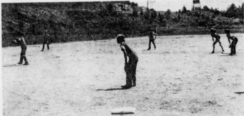
Les jeunes joueurs de baseball peuvent pratiquer leur sport préféré au parc Gouin. Chaque matin, et ce jusqu'au 31 août, les moniteurs de l'OTJ les recevront pour leur enseigner la science de frapper des circuits.