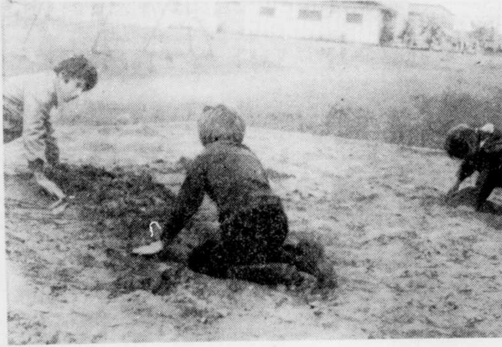
En marge de l'ouverture des terrains de jeux de la ville de Thetford Mines, le photographe de La Tribune s'est rendu sur les lieux et a croqué la scène suivante: combien d'architectes et d'ingénieurs ont vu naître une vocation de cette façon?