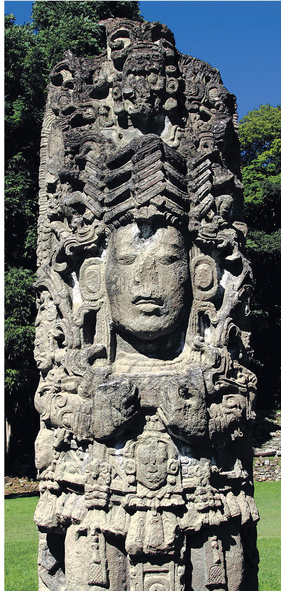
À la Grande Place de Copán, la stèle représentant le roi Waxaklajuun Ub'aah K'awil (surnommé «18-Lapins»).