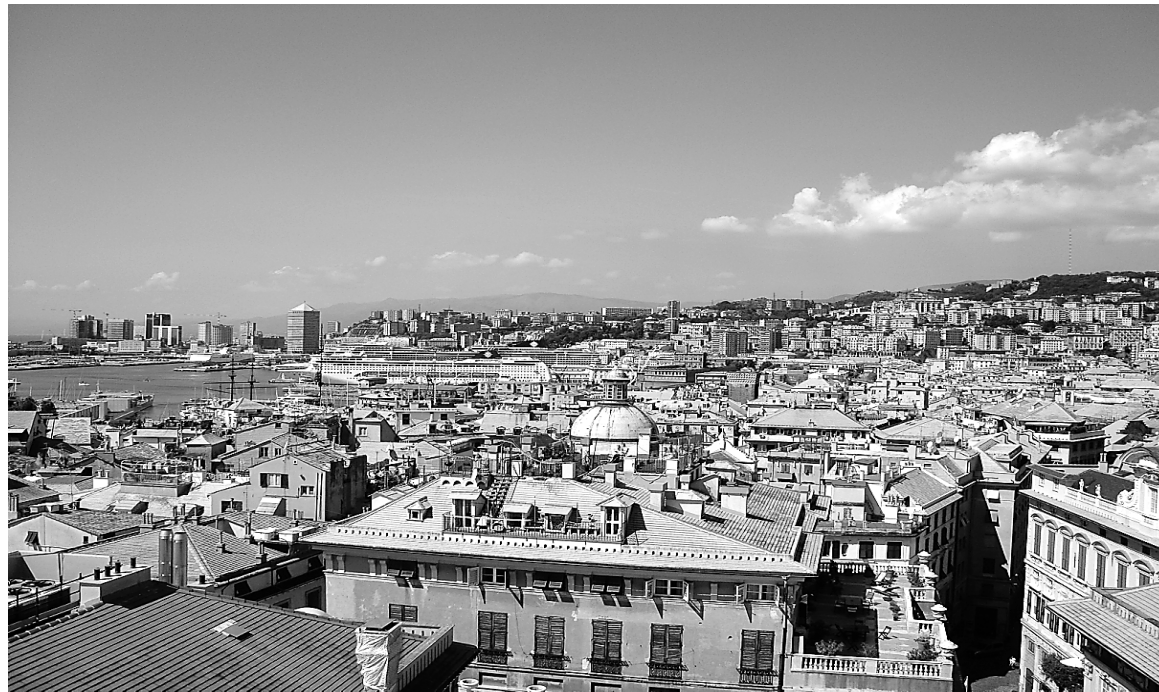
Vue générale de Gênes

Classés monuments patrimoniaux par l'UNESCO en 2006, les palais