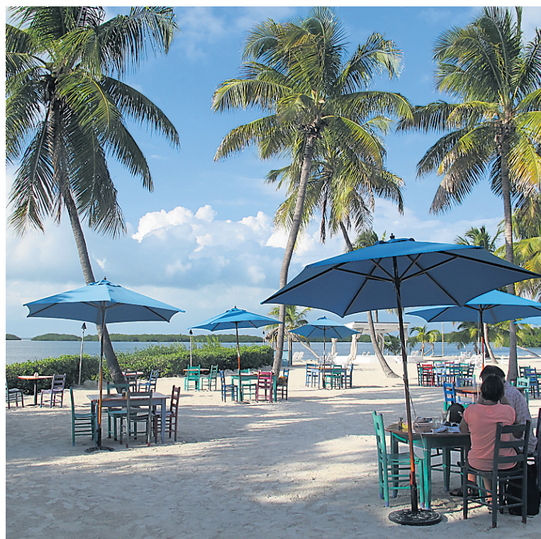
Au Morada Bay Cafe, on mange les pieds dans le sable!

Situé à l'étage d'une belle maison victorienne, le restaurant Point 5 est un endroit fort agréable pour