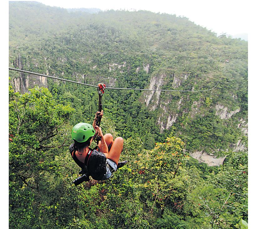
Une des six tyroliennes de plusieurs centaines de mètres à La Campa.

Je suis au pied de «l'Acropole». Les silhouettes de deux temples se découpent dans les arbres et le ciel. Un sentier et des escaliers montent au sommet, d'où s'étirent de grands arbres, déployant leurs racines dans les ruines. Je savoure une vue géniale sur la Grande Place au nord alors qu'au sud une pyramide s'élève au milieu de deux cours, cernées de plate-formes et de bâtiments moins hauts. Grandiose! En contrebas, des couloirs creusés par