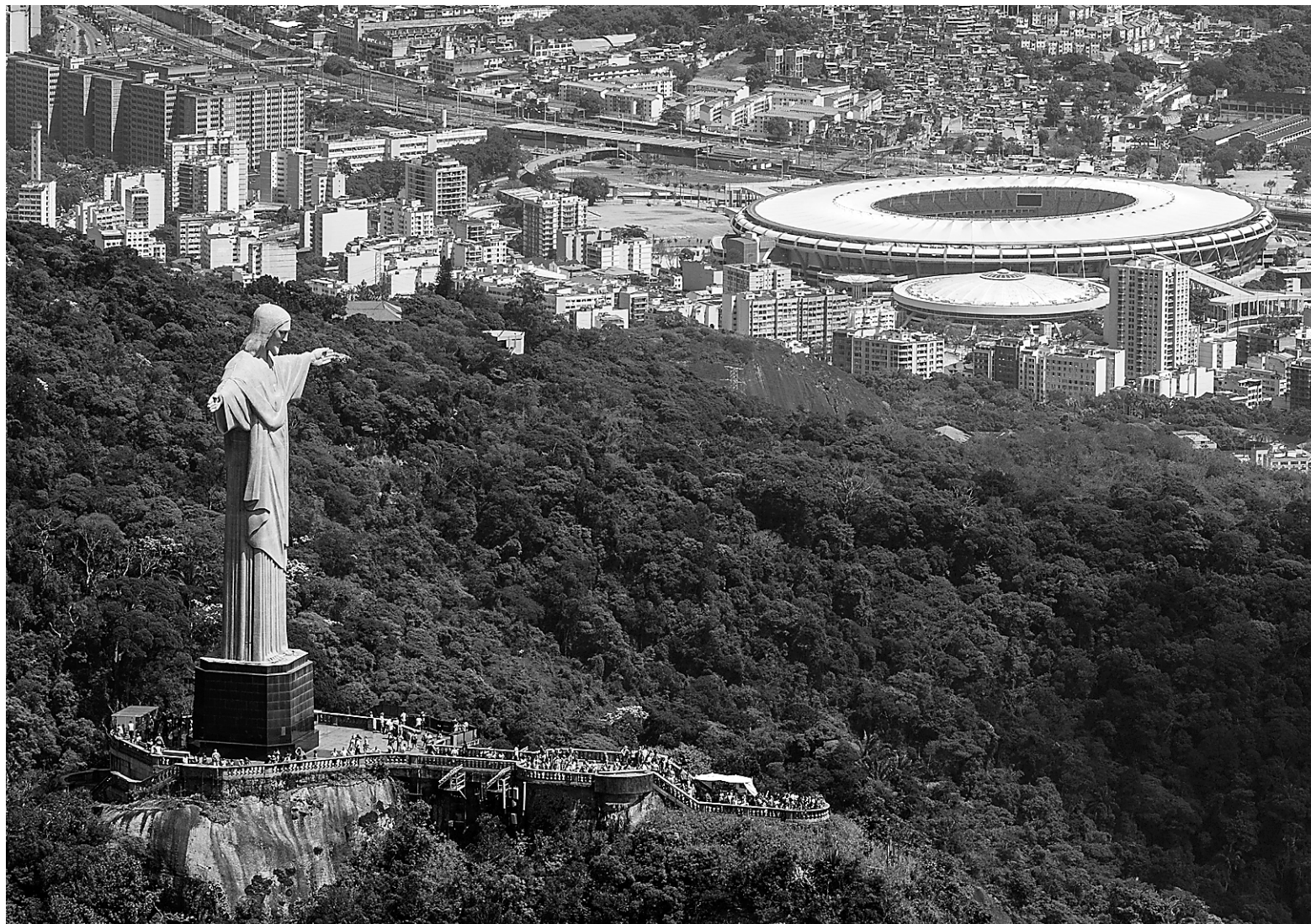
La célèbre statue du Christ Rédempteur, située sur le mont Corcovado, surplombe le stade Maracanã, qui accueillera le Mondial l'été prochain ainsi que les Olympiques d'été de 2016.