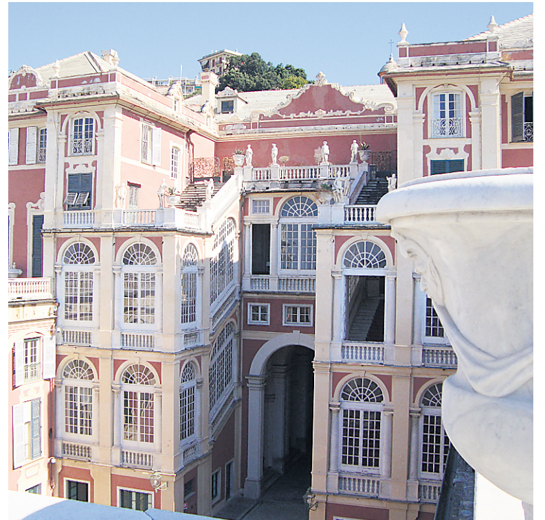
Le Palazzo Reale