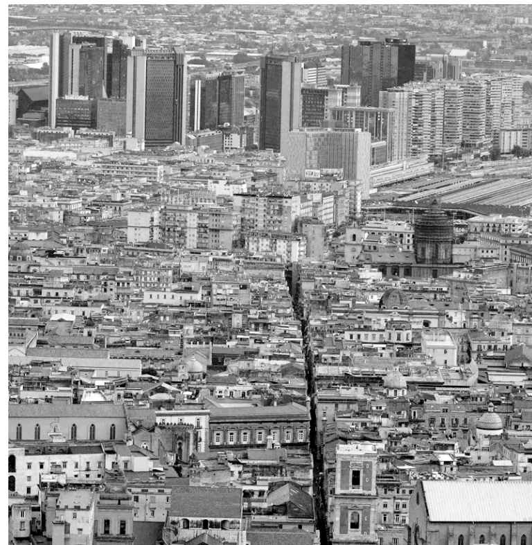
La ville de Naples s'est classée en 107 e et dernière position en Italie quant à sa qualité de vie en général.