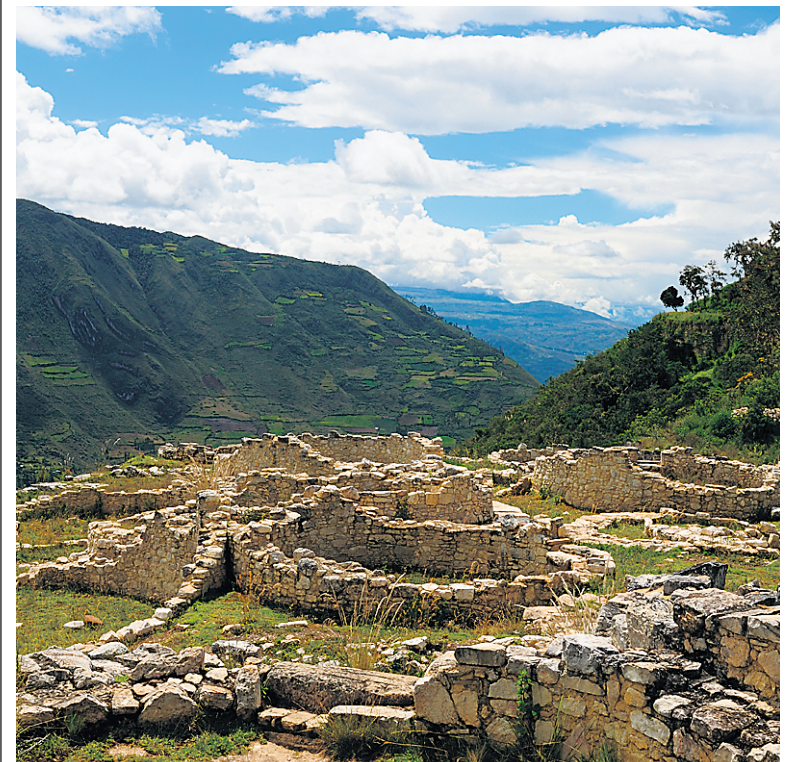
Le vestige le plus connu des Chachapoyas est la grande forteresse de Kuélap, située sur la cime du Cerro Barreta.

Les Chachapoyas ont laissé de nombreux vestiges dont le plus connu est la grande forteresse de Kuélap, un ensemble architectural en pierre de grande dimension avec une plate-forme artificielle, situé sur la cime du Cerro Barreta (à 3000 mètres d'altitude).