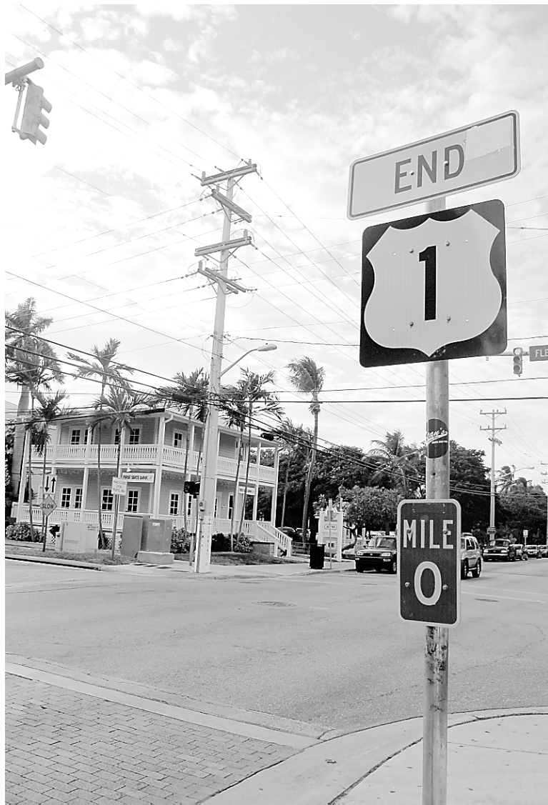
Une enseigne marque la fin de la route 1, à Key West.