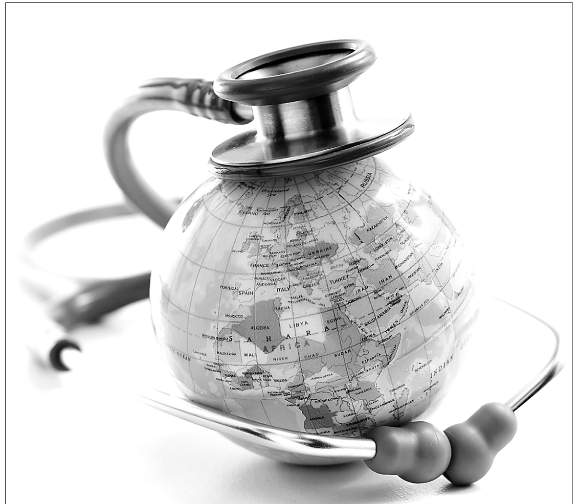
Près de 40 % des Canadiens ayant reçu des soins médicaux à l'étranger n'étaient pas protégés par une couverture d'assurance, révèle un récent sondage mené par l'Association canadienne de l'assurance voyage.

Lorsqu'un patient reçoit son congé d'un hôpital de la République dominicaine, par exemple, il