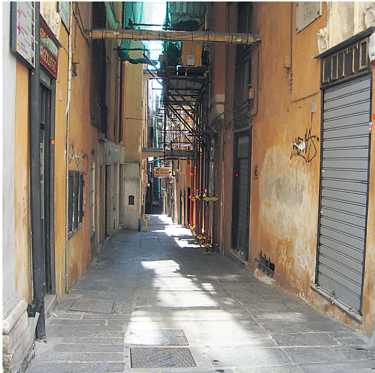
Les carruggi de Gênes, un dédale de rues sombres et d'impasses