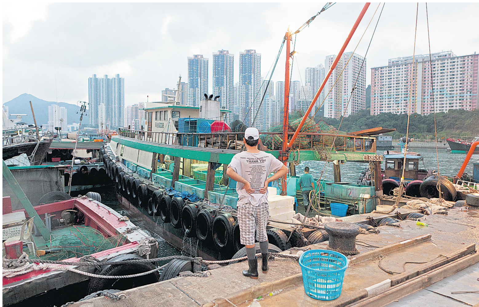
La pêche ne représente plus qu'une part minuscule de l'économie du territoire de Hong Kong : 1,8 milliard $, soit moins de 0,1 % du PIB.

En janvier dernier, le gouvernement a interdit le chalutage, pour