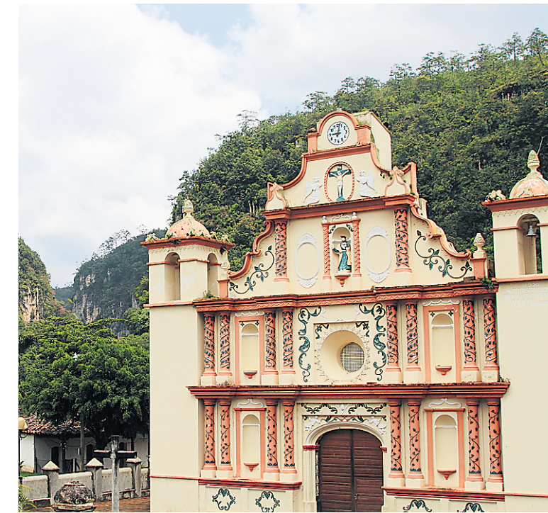
La petite église du village lenca de La Campa. Derrière s'ouvre un vaste canyon traversé de tyroliennes.

Au matin, nous franchissons encore vau et montagnes. Le spéléologue en moi est ravi d'arrêter pour une incursion à la grotte de Taulabe, une cavité aménagée sur plusieurs centaines de mètres, au gabarit respectable. Nous terminons l'escapade en longeant le majestueux lac Yojoa. Alors qu'un panorama lacustre nous coupe le souffle, une pittoresque muraille de cantines