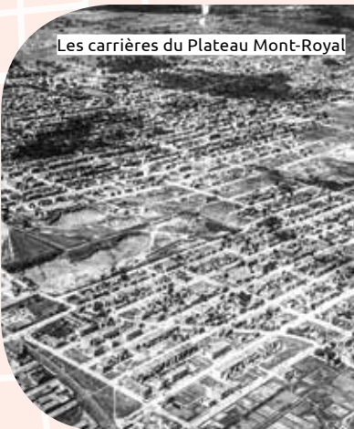
Les carrières du Plateau Mont-Royal

Les ancêtres du Plateau Mont-Royal, ce sont les villages de Saint-Jean-Baptiste et Coteau-Saint-Louis, annexés à Montréal en 1886. Arrondissement ouvrier, comme plusieurs autres à Montréal, marqué par la présence de carrières, il se développe économiquement et s'embourgeoise. Il devient à forte saveur culturelle. Aujourd'hui, le Plateau Mont-Royal est encore reconnu à Montréal comme un lieu de bien-être artistique et culturel.