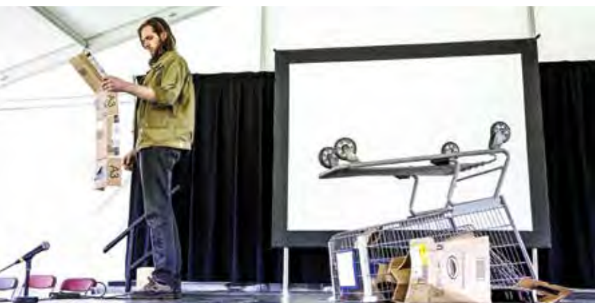
Aux commandes d'un chariot d'épicerie, le héros de cette déchirante dérive cherche une figure de proue pour son navire sans gouvernail.

Puisque ce spectacle, véhicule d'une parole trop peu entendue, a exigé beaucoup d'efforts, il serait intéressant qu'il soit monté à nouveau, non ? Le 14 janvier dernier, le Conseil des arts de Montréal en tournée convie Métropolis bleu à le soumettre aux diffuseurs du Grand Montréal susceptibles de le produire en leurs murs l'année prochaine. À suivre ! ■