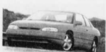
MONTE CARLO 95