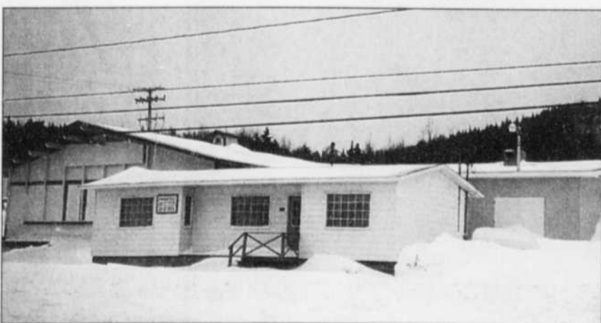
L'usine Tourelle Marée est au coeur d'une saga judiciaire.