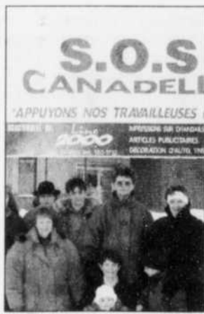
Appui « ex » de Canadelle

Les 190 ex-travailleuses de Canadelle ont complété leur dernier jour de travail mardi. Si certaines demeurent encore en poste jusqu'au 5 février, d'autres sont déjà forcées d'avoir recours à l'assurance-chômage. « Et nous refusons de devenir des assistées sociales. »