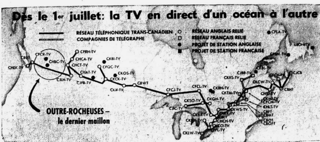
Le réseau micro-ondes transcontinental, inauguré le 1er juillet, place la télévision canadienne au premier rang du monde quant à l'étendue du territoire desservi. On sait déjà que le Canada possède également le plus important réseau de langue française et que Montréal est, en outre, le troisième centre mondial pour la production des programmes de télévision en direct.

Savez-vous ce qu'est la conduite préventive d'un véhicule automobile, vous demande le Comité provincial de Sécurité routière (Prudentia)? La conduite préventive, c'est d'abord le flair de prévoir les obstacles qui peuvent se présenter à soi sur la route ou dans les rues des villes; c'est ensuite la capacité physique de parer aux obstacles, soit en modérant, en arrêtant, en virant; enfin, c'est le soin apporté à l'entretien de sa voiture afin que cette dernière soit constamment en parfaite condition. Ceci étant dit, demandez-vous si vous conduisez d'une façon préventive.