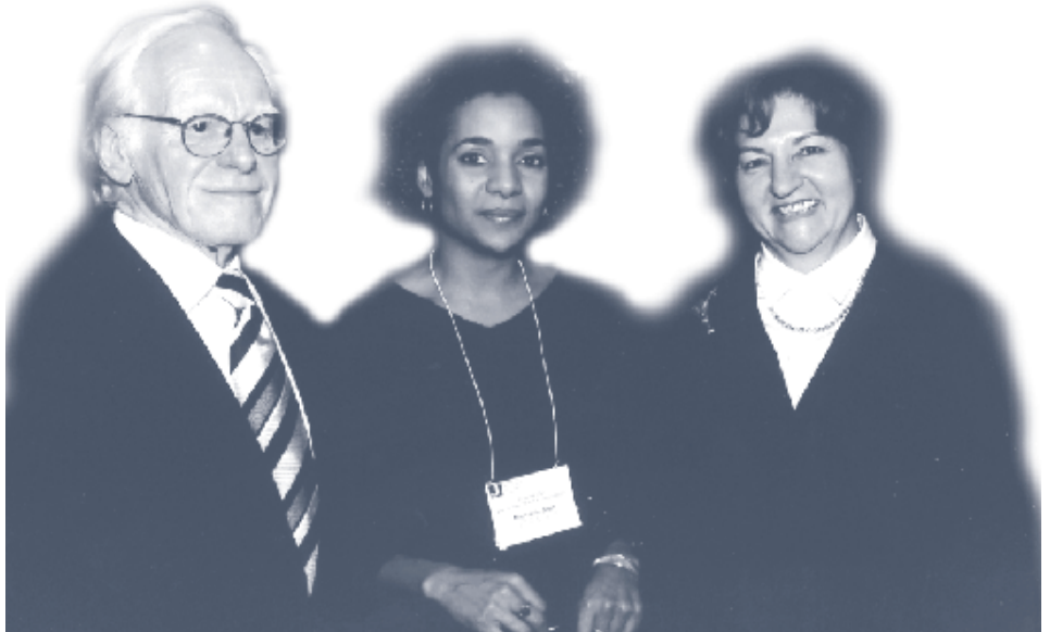
La présidente du Conseil en compagnie de Pierre Bourgault, récipiendaire du prix Jules-Fournier, et de Michaëlle Jean, première récipiendaire du prix Raymond-Charette.

Les personnes intéressées à soumettre leur candidature pour les prix Jules-Fournier et Raymond-Charette 2001 sont priées de communiquer avec le Conseil de la langue française en composant le (418) 643-2956.