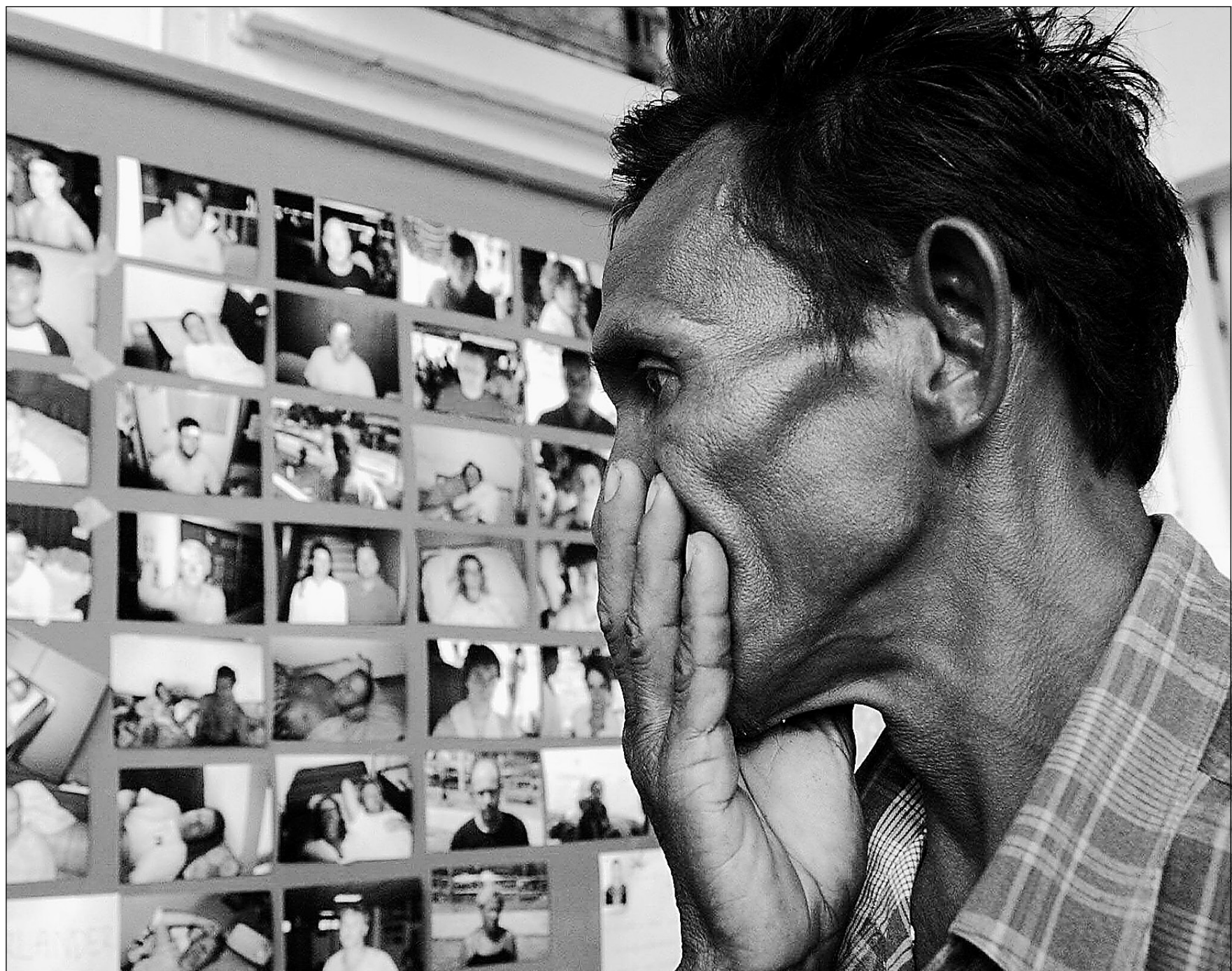
Ce Thaïlandais cherche la photo de son petit-fils disparu, sur le tableau d'affichage d'un hôpital.

Si à Saint-Jean la fracture numérique est perceptible dès le premier coup d'oeil, les choses ne s'améliorent évidemment pas dans le monde rural. Terre-Neuve est constituée de bourgades isolées de quelques centaines d'âmes, au plus de quelques milliers pour les plus grosses. Entre Saint-Jean et Port-aux-Basques, les deux extrémités de l'île, il faut compter près de 900 kilomètres de la route transcanadienne 1. Les 500 000 habitants de la seule île de Terre-Neuve sont éparpillés sur un territoire grand comme presque quatre fois la Belgique pour une population 20 fois inférieure. Ils ne constituent donc pas une priorité pour les investisseurs en télécommunications.