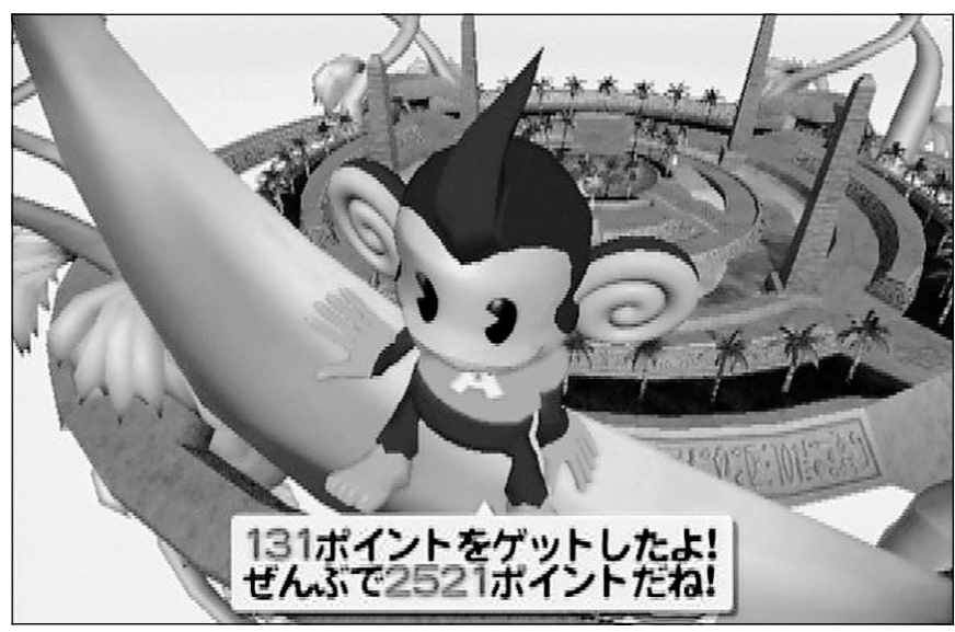
Super Monkey Ball est un petit jeu de plateforme où un sympathique petit singe pratique frénétiquement le bowling, le baseball et autres jeux de balle.

Pour que les chirurgiens soient au mieux de leur forme lorsqu'ils ont besoin de ces compétences au