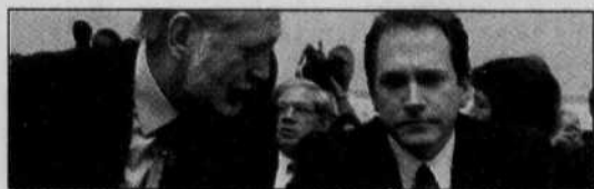
Bernard Ebbers et Scott Sullivan, deux anciens dirigeants de Worldcom: le droit de se taire.