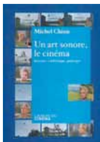
Un art sonore, le cinéma