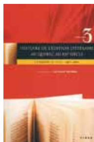
Histoire de l'édition littéraire au Québec au XX e siècle