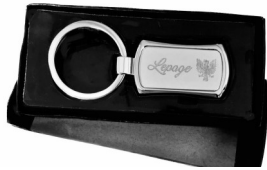
Porte Clef-Key Chain $ 10.00