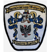
Écusson-Crest- $ 10.00 3.75''x 4''