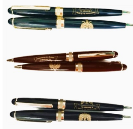
Stylo-Pen- $ 5.00 Noir-Marin-Rouge Black-Navy-Red