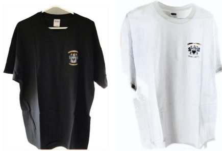
T-Shirt-Noir ou Blanc (M-L-XL-XXL) -Black or White - $ 15.00