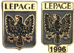
Bouton Prestige-Pin- $4.00 1''x 1.5''