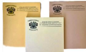
Calepin- Note Pad 4.25''x5.5''- $ 2.00