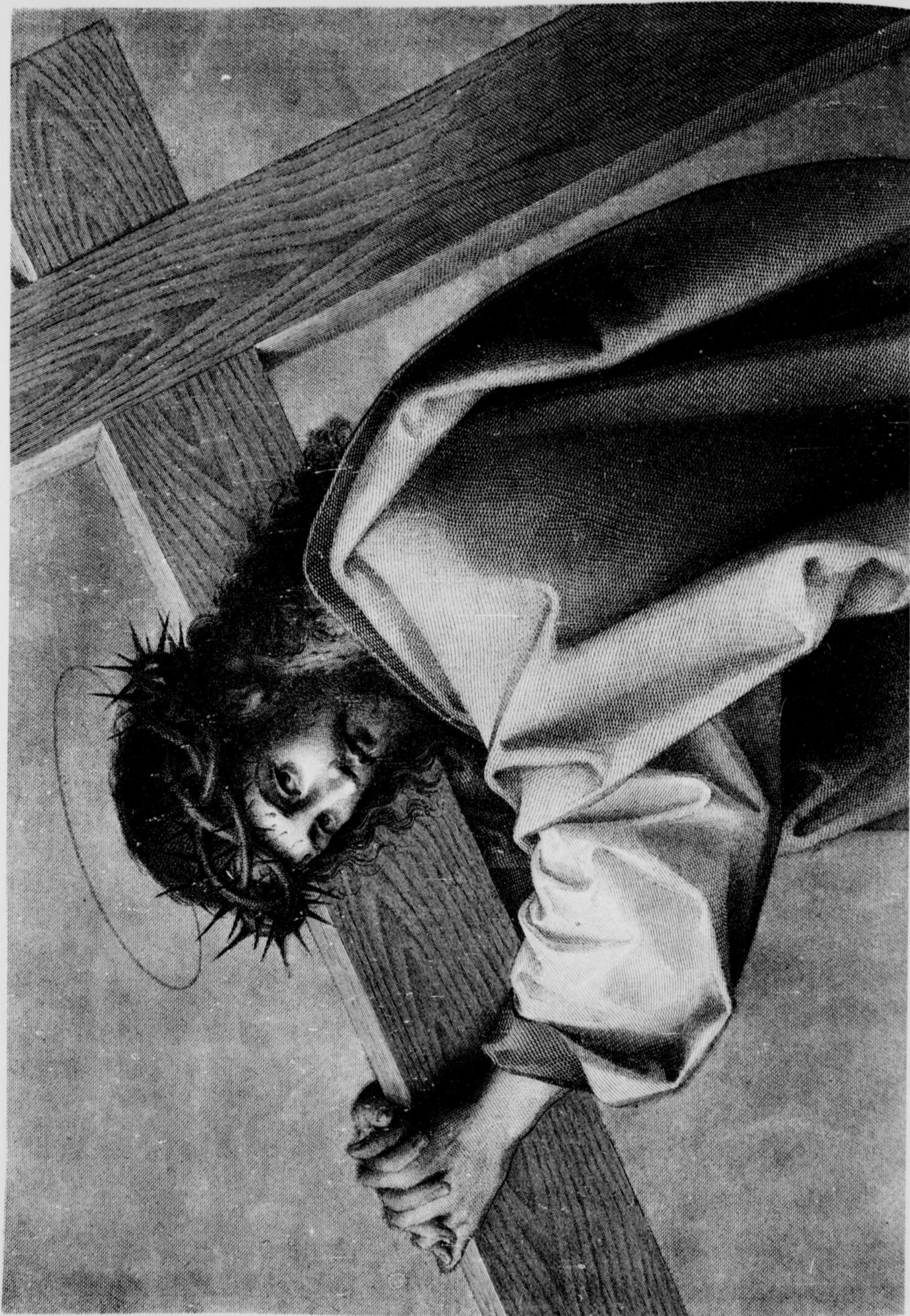
"LA SEMAINE SAINTE.—VIA DOLORES."—D'APRÈS RAPHAËL URBINO.