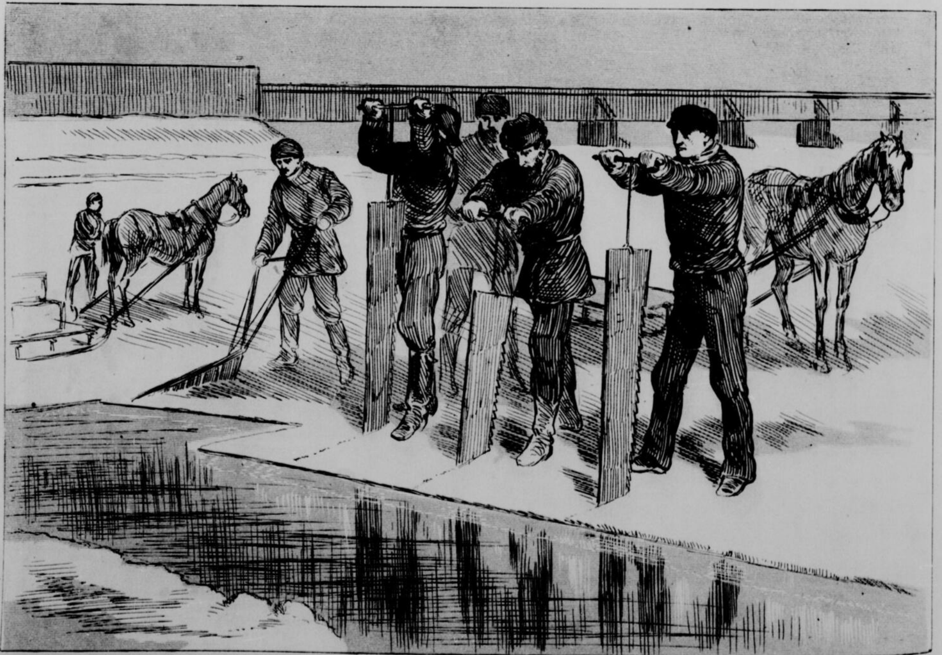
LA RÉCOLTE DE GLACE SUR LE St. LAURENT.