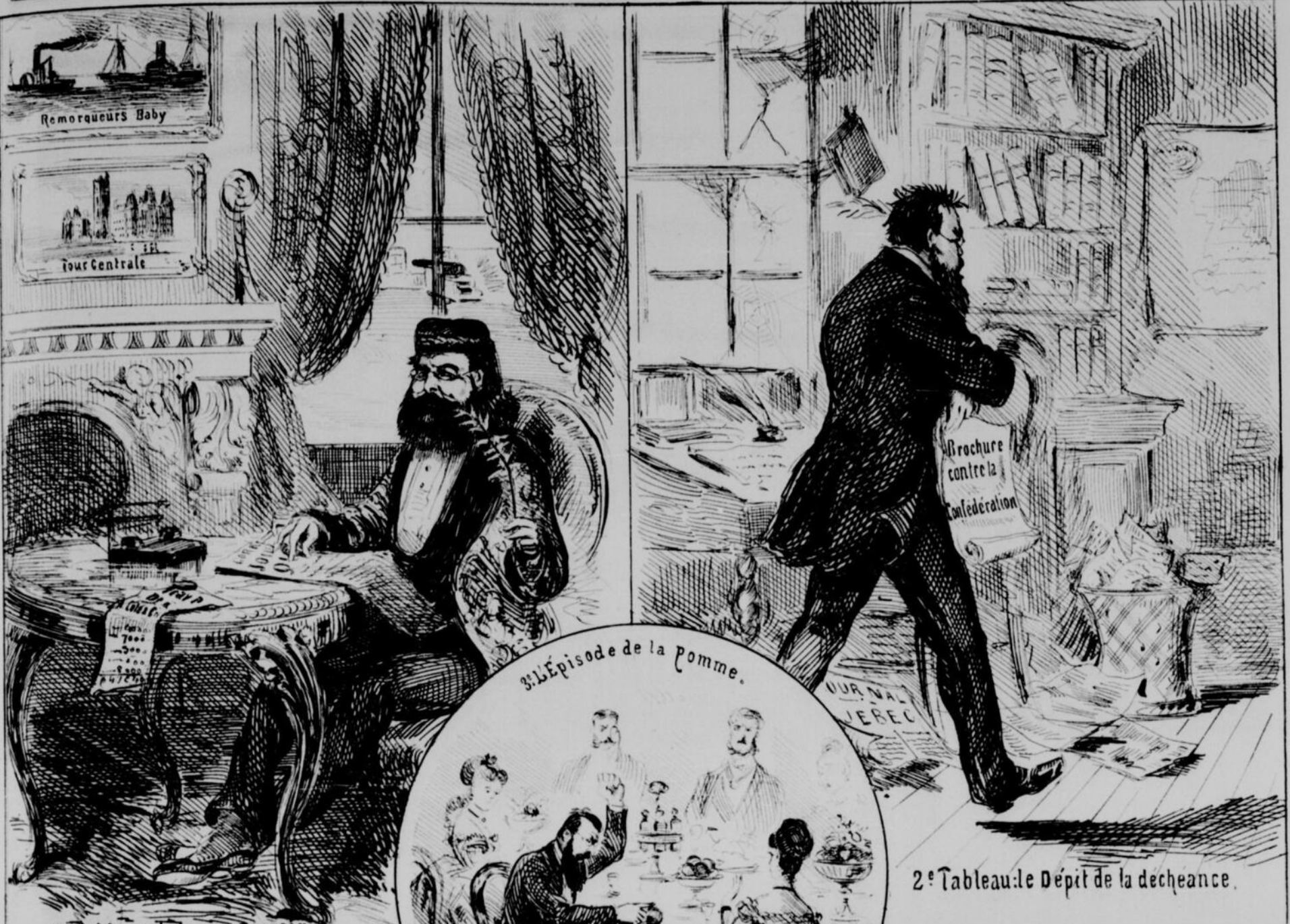
1 er Tableau: Le Luxe du Pouvoir.