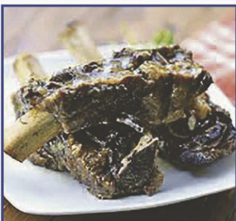
Bout de côtes levées de porc assaisonnées