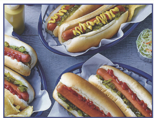
Saucisses fumées 1 kg