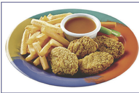
Bouchées de poulet panées