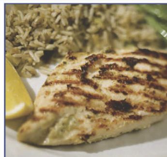
Poitrines de poulet marinées aux fines herbes