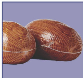
Jambon toupie 1,6 kg