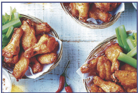
Ailes de poulet congelés - nature 2 kg