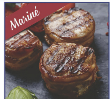
Tournedos de porc tériaki