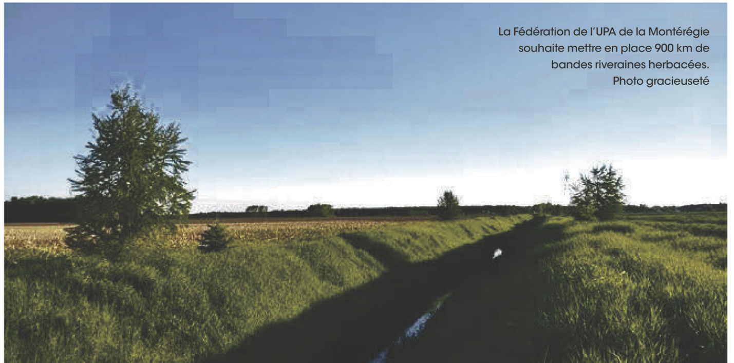
La Fédération de l'UPA de la Montérégie souhaite mettre en place 900 km de bandes riveraines herbacées.

d'autant plus porteur, car il implique la collaboration de plusieurs partenaires issus du milieu municipal, dont les MRC et les municipalités ainsi que les agronomes des clubs conseils de la Montérégie. C'est en travaillant tous ensemble qu'on arrivera à agir pour une agriculture durable », affirme le président de la Fédération de l'UPA Montérégie, Jérémie Letellier.